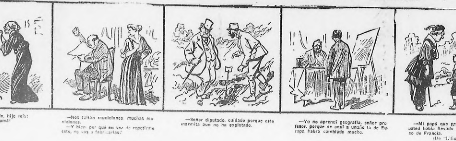
—¿Cómo has engordado, hijo mío? —Yo no adelgazo, mamá!

—No faltan municiones, muchos municiones. —¿Señor diputado, cuidado porque esta marmita aún no ha explotado.