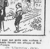
—¿Cómo has engordado, hijo mío? —Yo no adelgazo, mamá!

—No faltan municiones, muchos municiones. —¿Señor diputado, cuidado porque esta marmita aún no ha explotado.