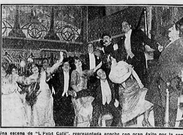
Una escena de "Le Peut Cate", representada anoche con gran éxito por la compañía de la divette mejicana Esperanza Liris.