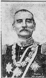
Peter I. rey de Serbia

Ha comenzado la acción combinada, que ha de ser la muerte de Teutonia. Bulgaria al movilizar sus tropas, día a día de alerta. Y todos los países aliados como uno solo suplican respuesta a la gravedad del momento. Esa vez habrá sufrido el dicho por, para una variación: "el que se acerca al diablo, es el que paga más caro".