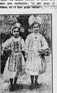
Los hermanos del príncipe heredero de Bulgaria, príncipes Cirilo y príncesa Eugenia y Eudoxia, esta última en traje nacional