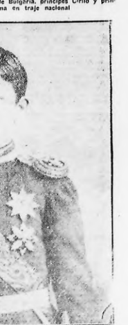
El príncipe Boris, heredero de Bulgaria