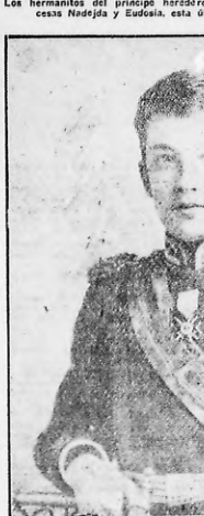
El príncipe Boris, heredero de Bulgaria