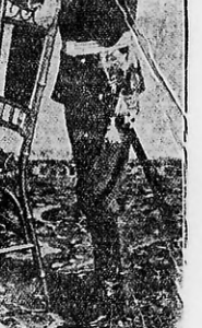
El príncipe Boris, heredero de Bulgaria