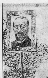
Manifestación popular del pueblo de Atenas en favor de los aliados. — En el marco, Venetoz