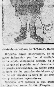
(Notable caricatura de "L'Asino", Roma)