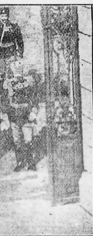
Oseanbranco en uno de los puentes de la Macedonia, de artillería y oficiales franceses, que desde hace un mes se preparan para la defensa de Belgrado.