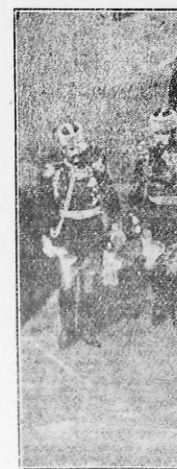
Momento de salir del palacio imperial de Bulgaria el general Fitzchev, con rumbo a la actividad asumida por el zar Fernando