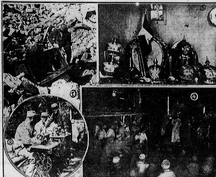
UNA CABA DE CAUDALES ENCOMENTADA ENTRE LAS RUINAS DE LA BARRERA DE LOS TROPAS FRANCESAS EN LA TOMA DE TAURE—UNA HE PRESENTACION TEATRAL EN USO DE LOS ACANTONAMIENTOS

El objetivo será el mejor, el más exacto, el más imparcial de los testimonios que con la historia para trazar las páginas sangrientas de esta época de los siglos y de las civilizaciones.