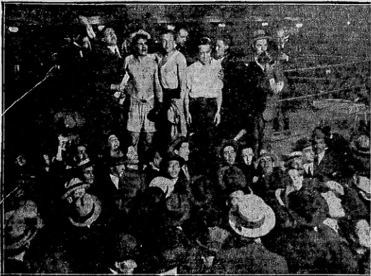
La proclamação del vencedor, campeón de su clase.

Mucho antes de la hora fijada para el encuentro, los alrededores del nuevo local de fiestas del Boxing Club, presentaba un aspecto de animación extraordinaria, y gran cantidad de aficionados aguardaban impacientemente en la puerta de este club, el momento de entrar al salón.