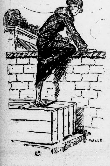
Así tentando más remedio, la señora apela a un recurso cinematográfico y salta por los fondos la tapia de 3 metros.