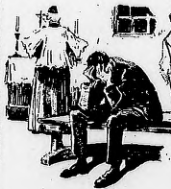
Un reo en capilla

Un tribunal militar condenó a sufrir la pena de "garrote vil" a tres asesinos de los delincuentes. Y en España una treintena de tal castigo no puede considerarse a una sanción jurídica; constituye una venganza "popular"; muy de acuerdo con la feroz costumbre española de los cuarteles actuales del poder en España.