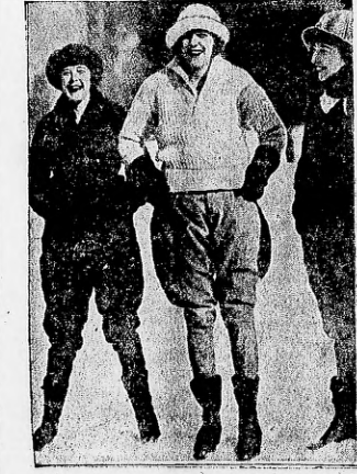
LAS MUJERES Y LA PROHIBICION — He aquí una agente de la ley, de Kentucky, la única de su sexo en Estados Unidos, que ha sorprendido a varios contrabandistas, consiguiéndolos gran fama. Pero... ¿quién no se deja sorprender por un encanto así? ¡Bah!... (Ilustración de la International News Service)

TOKIO, 10. — El príncipe regente recibió en audiencia al gobernador de la Indochina francesa, señor Bernier y esposa.