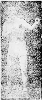
El gran pugilista irlandés Willie Farrell, que esta noche se medirá en L'Aiglón con el español de Walls.

EL PUGILISTA IRLANDES DEBE ACTUAR ESTA NOCHE CON LA DECISION QUE LE FALTO EN SU MATCH CON HEVIA