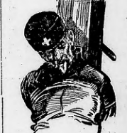
Carta de un reo ajustado en garrote

Es este aspecto más arcaico e inhumano de la vida civil en la penitencia, lo que el sargento mayor del directorio, creyó útil dejar intacto. Ni parlamentario, ni judicial, ni garantista por tanto; se lo el parroti ha quedado en pie. La sentencia de esa pena vil para el que la aplica permanece suspendida sobre la cabeza de los ciudadanos a quienes un proceso maniatado en el término de un par de días, no pone a cubierto su brevedad de la inmensidad del directorio para detener los desmanes de la delincuencia que avanza.