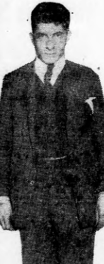
Grat. Virgilio Cabanellas