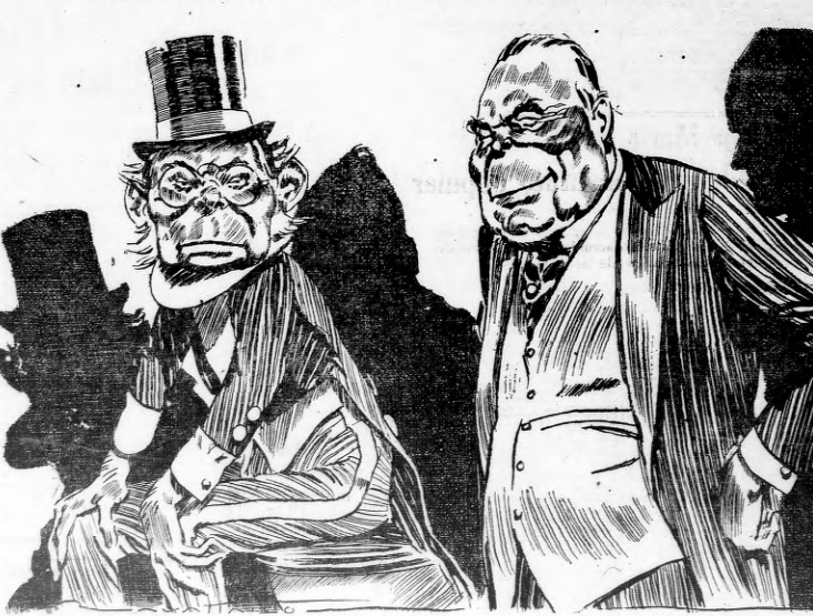
Si Francia lo hubiera tenido a Salinas, en vez de Poincaré... jubila el franco; ese con el pibe...