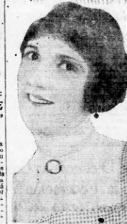
Constance Talmadge, la graciosa actriz que desempeña un doble papel en la exitosa película "El Parisienne" de Artistas Unidos.

La casa Film, alquiladora que viene desplazando una gran actividad, acaba de agregar a su stock de estrenos, un conjunto de películas españolas, elegidas entre las mejores. Entre otras, que pronto ensucenarse en halla: "La medalla del torero", "Mancha que limpia", "La hija del coreógrafo", "Diosa Corrientes", "A fuerza de arrastrarse", "Rosario la cortijera" y "En la habitación de Romeo".