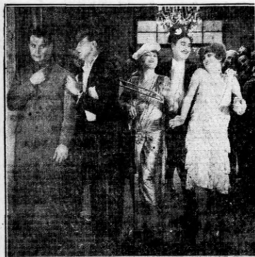
Una escena graciosísima y de gran sabor vienés de la divertida vodevil "El bailarín de mi mujer", que se estrenará el martes próximo en los cines Callao, Empire y Capitol.