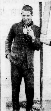
Grat. Virgilio Cabanellas