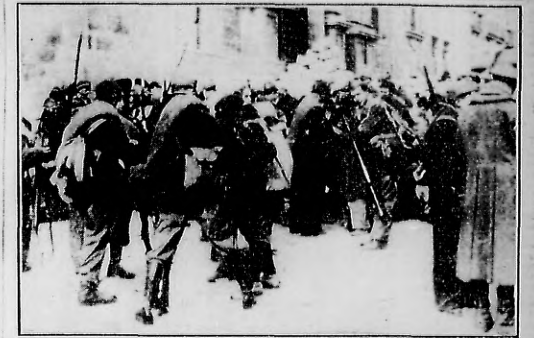
TROPAS DE CHOQUE del 50. batallón de infantería reuniéndose apresuradamente en una calle de Madrid, para dirigirse a reforzar uno de los sectores de la defensa de la ciudad, que resultó infranqueable por las aspiraciones de los partidos fascistas, que anuncian su inminente caída desde hace seis meses.

En el frente de Vizcaya, sector de Orduña, el enemigo hostigó continuamente las posiciones vascas, sin obtener resultados. La artillería bombardeó las posiciones enemigas en San Martín. La aviación adversaria lanzó algunas bombas sobre la vía férrea, sin alcanzar su objetivo. En otros sectores no se ha registrado ninguna actividad."