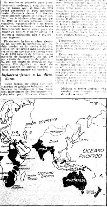
ESTE MAPA muestra las colonias que forman el vasto imperio británico.