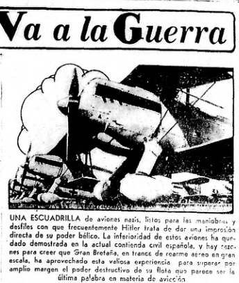
Una ESCUADRILLA de aviones nazis, lista para las maniobras y desfilos con que frecuentemente Hitler trata de dar una impresión de su poder bélico.

En Gran Bretaña se están produciendo disturbios. El gobierno ha tomado medidas para mantener el orden.