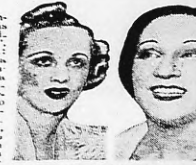
Las actrices Paulla Singerman y Eva Franco