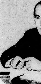
EL DIRECTOR GENERAL de Aeronáutica Civil, Dr. Carlos Nevea...