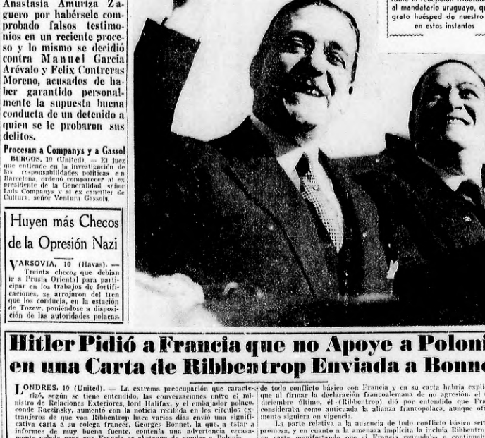
Los mandatos uruguayo y argentino, Genl. Baldomir y Dr. Roberto M. Oribe, respondiendo con evidente complacencia los reiterados saludos que fueron objeto a su paso por la calles céntricas de la ciudad durante la recepción tributada hoy al mandatario uruguayo, que es grelo huésped de nuestro país en estos instantes

Recordando que los ciudadanos de Danzig habían declarado su posición el 26 de octubre de 1918, y la actualidad los ciudadanos de Danzig a que han aceptado el régimen de Danzig-Singel como sus antepasados, tiempo temprano los ratifica del pueblo."