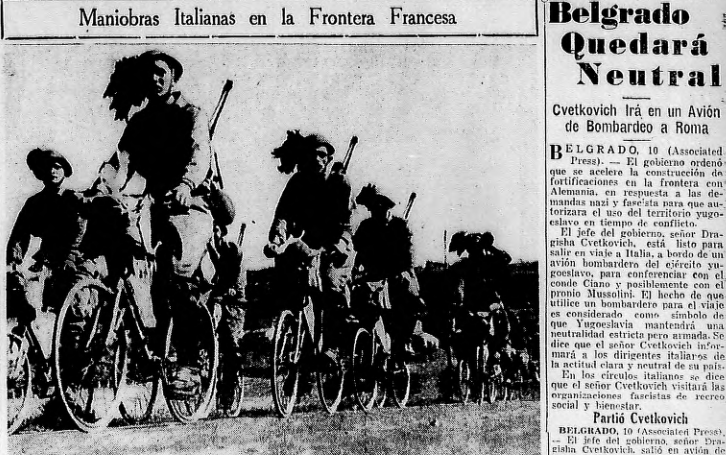
Maniobras Italianas en la Frontera Francesa