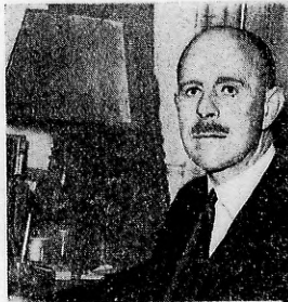
EL VIZCONDE GORT, mayor general y jefe del Estado Mayor del Ejército británico, dirigirá en la próxima guerra la ofensiva terrestre. La opinión inglesa lo considera el más brillante militar del Imperio.