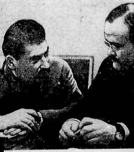
STALIN y Molotov mantienen despierta la atención del gabinete comunista sobre un primer plano en el momento europeo. En el panorama de la España negra, decretado un turbio repulso de sangre, se ve surgir mezquino y siniestro, como el entregado de su patria a las exigencias del "Eje".

LE ESTABA CHICO —Me va a tener que cambiar el coche, pues éste me ajusta un poco debajo de los brazos.