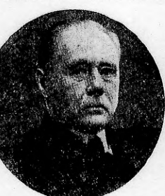
CON SUS 73 años, Maurice Gamelin, el jefe supremo de todas las fuerzas de la República Francesa, es el militar de punto fuerte. Discreto y frío, encabezará sin duda las fuerzas antiaéreas movilizadas contra un cerco imbatible para destruir el "Eje".