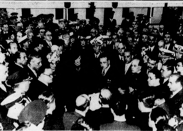
El Intendente Municipal Saluda en Nombre de Buenos Aires al Primer Magistrado Uruguayo

Flores y Saludos Si bien entre los saludos protocolarios del desembarcadero, el entusiasmo puso una nota incontestable de cordialidad hacia el representante del país hermano, Santa Fe. La vibración popular fué sostenida de tono, hasta adquirir las características de un entusiasmo y entusiasmo. Los dos balcones adyacentes al desembarcadero, de donde se recibían flores al paso de los señores, eran los de los señores, que iban en segundo término con respecto a las esposas de miembros de la comitiva y damas argentinas que las acompañaban.