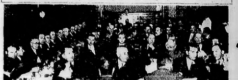
UNA FESTA parcial de la comitiva ofrecida anoche por los componentes de la Agrupación Galicia, del Centro Gallego de esta ciudad, al celebrar la reunión mensual de los socios, en la que se celebró un banquete en el salón de la Unión de la calle de Rivadavia y otros platos de la cocina gallega.