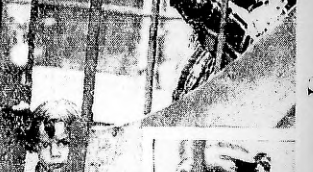
LA SEMANA de Pascua y sus fiestas, en la casa de la calle de Rivadavia y otros platos de la cocina gallega.

Como antiguos mafiosos, la policía de Montevideo, que se ha convertido en un problema de vital importancia para el trabajador de la construcción.