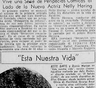
UNA PASAJE de la película "Esta nuestra vida"...

MIRIAM. "Esta nuestra vida". Comedia dramática de Formentor, dirigida por Ramón Herrera.