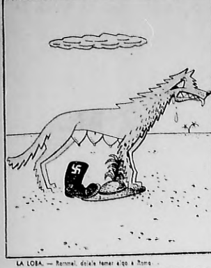
LA LOBA... Remonta desde el mar al norte...