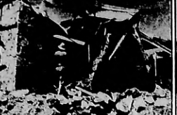
UNA BOMBA AEREA japonesa cayó sobre este campamento de aviación de la Fuerza Aérea de Australia, cerca de Darwin, el día 19 de febrero. Se ve a los oficiales que se apresuraron a salir del campamento.