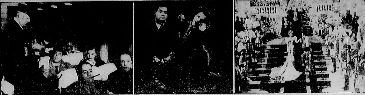
ALLAN LADD. Homenaje al descubrimiento de Hollywood y a España y "Por mérito y redención" en un papel de Juan Francisco Lita, la segunda noche de "Fiesta". Se comedia dramática de Formentor. Un cine argentino, a estrenarse el jueves próximo en el cine Orens