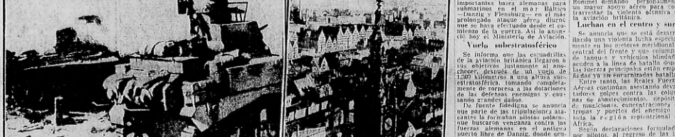
LA TERrible batalla de tanques en Libau, dos resultados como este: un tanque alemán destruido, y un tanque británico que lo destruyó.

★ LUCHA DE TANQUES * DANZIG ATACADA ★ Astilleros en Llamas LONDRES, 12 (Unión). — Después de haber tomado 2.000 prisioneros y destruido una gran cantidad de tanques, se retiraron a sus posiciones.