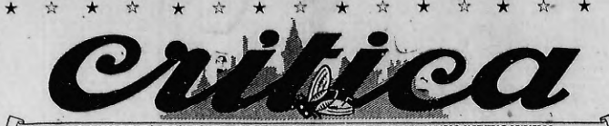
DIOS ME PUSO SOBRE VUESTRA CIUDAD COMO A UN TABARRO SOBRE UN NOBLE CABALLO PARA HACERLO Y TENERLO DESPIERTO (HOCRAETE)