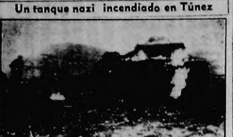
Un tanque nazi incendiado en Túnez ESTA FOTO dramática fue tomada en el frente tunecino y nos muestra un tanque nazi incendiado. Obsérvense en la izquierda el soldado americano que corre hacia el tanque para capturar a los tripulantes del mismo, que lo destruyeron antes de ser visto.