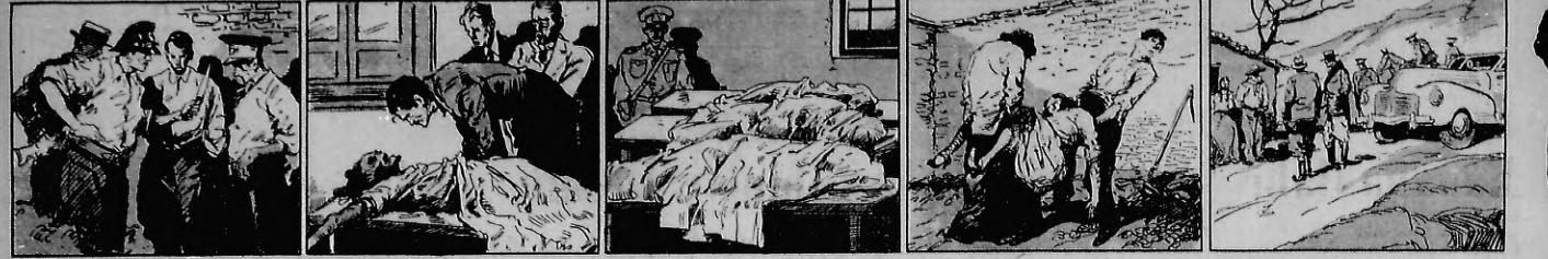
LOS BOMBEROS, que han trabajado afanosamente por la vida de los accidentados, son quienes hoy, en un momento de calma, se ocupan de trasladar a los heridos a los hospitales. En la parte superior, el cuerpo de un de los muertos, que se encuentra en la macabra tarea de enterrar a sus víctimas.