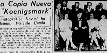
Eligieron la obra del debut "Los Elementos"...