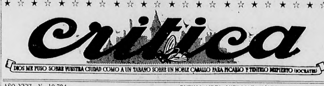
DOSS MI PULO SOBME MUESTRA CIUDAD COMO A UN TABARNO SOBME UN NOBLE CABALLO PARA PICARLO Y TENTARLO MANTENGO VOCALIZADO

En la zona de Vinnitsa, las fuerzas nazí continuaron sus movimientos ofensivos, apoderándose de 70 localidades y tomando 1.300 prisioneros. En este sector, los alemanes sufrieron una pérdida de 1.800 hombres entre muertos y heridos. En tanto que en Zhmierinka los rusos poseían avanzados rápidamente. En el sector de Tiraspol, la desorganizada retirada nazí ha continuado con un ritmo acelerado. Prosigue la violenta lucha en las calles de la ciudad, donde los ataques como se observa en los combates anteriores. Ocho soldados soviéticos luchan con fanatismo, en cumplimiento de la orden recibida del señor Hitler de defender la ciudad a toda costa. Las acciones de ayer y las de hoy fueron avasalladas por las tropas alemanas, que en sus intentos de avanzar, sufrieron graves pérdidas. Tropas especiales alemanas de choque fueron traídas apresuradamente a este sector, las que a su vez sufrieron graves bajas en sus encuentros cuerpo a cuerpo contra los soviéticos.