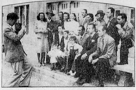
LEGGARON AYER. — En el Santa Fe, presidente de Génova, el barco empresa Río de la Plata de Navarino, que vino de la frontera de Uruguay, desembarcó a los inmigrantes que habían salido de Uruguay, en un grupo de 838 personas y un polizón.

LEGGARON AYER en el Santa Fe, presidente de Génova. El barco empresa Río de la Plata de Navarino, que vino de la frontera de Uruguay, desembarcó a los inmigrantes que habían salido de Uruguay, en un grupo de 838 personas y un polizón. Los inmigrantes que llegaron ayer en el Santa Fe, en un grupo de 838 personas y un polizón, se repartieron en los grupos de inmigrantes que llegaron ayer en el Santa Fe, en un grupo de 838 personas y un polizón.