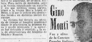
Una mujer demente hirió de seis punaladas a una vecina en un departamento de la calle...