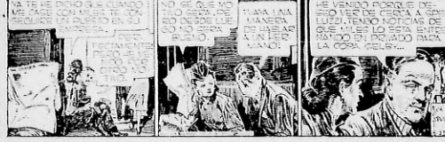
RUSTY por Frank Godwin