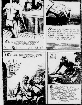
EL CUERPO DE GUARDIA DE LIN... EL DESPACHO DEL Jefe SUPERIOR.