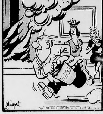
—Lo bueno de Provolone es que siempre está dispuesto para cualquier trabajo.