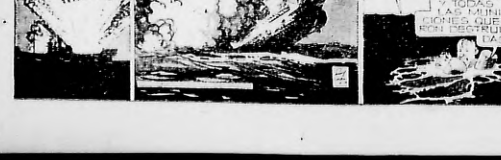
BUZ SAVYER por Roy Higgins