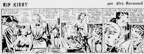
RIP KIRBY por Alex Raymond