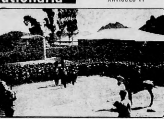
ANTES DE LA DERROTA. - Vista parcial del ejército italiano, antes de su derrota en la batalla de Adwa por los abisinios. Se ve el campamento y se ven las banderas de los abisinios.