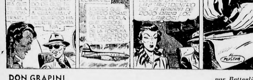
BARRY NOBLE por Al Plastino