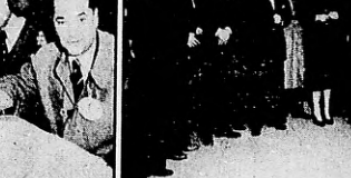
o a apreciar en forma directa la calidad y eficiencia de los penitenciales que, por esta vía, serán trasladados a Brasil en un avión especial de F.A.M.A., cuyo jefe de Priso y