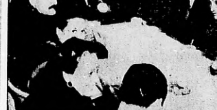
En AVION DE LA FAMA, — Desgranaron en Buenos Aires, el momento en San Pablo y podrán tener paulatinamente el de los cinco en Río de Janeiro, los penitenciales que, involucra a un avión especial de F.A.M.A., cuyo jefe de Priso y