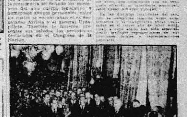
AGUSTÍN MORALES DE OJEDA