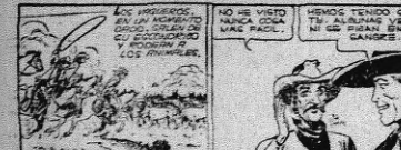
TUCUTA por J. Carver Pusey