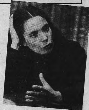
Metida de nuevo en el mambo solista, este mes se arriesga a dos Opera.