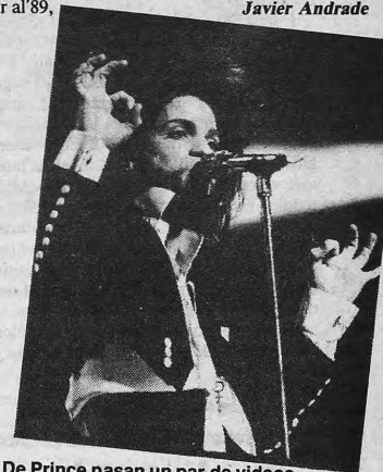
De Prince pasan un par de videos impresionantes.

aporte a los mensajes concientizadores de organizaciones probadas como Greenpeace o Amnesty International. Eso tranquiliza nuestras conciencias y combate las críticas dirigidas a la televisión como medio alienante, en especial las dirigidas a la TV puramente musical. Y además no deja de ser una voz de alerta para un montón de cabeceitas jóvenes. Con eso, y con ocupar un espacio algo más amplio en lo cultural, por ahora nos alcanza". El tiempo, avalando o no este trabajo crecimiento, tendrá la palabra. Music 21 , ¿alternativa o signo de los tiempos?