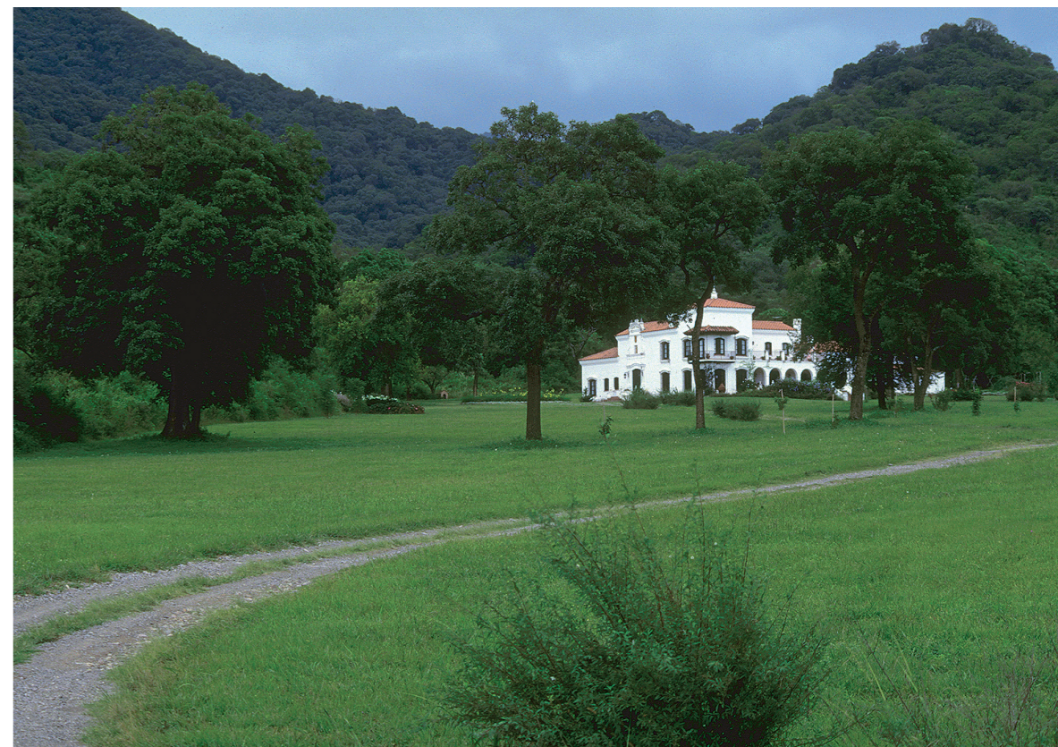
Alrededores de San Lorenzo, un destino veraniego preferido por los salteños.