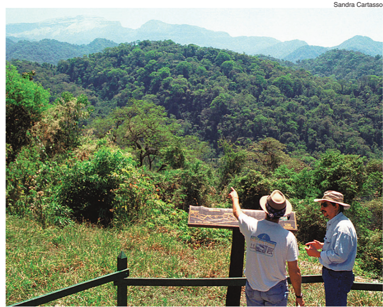
Las Yungas. Una densa selva tropical que el verano envuelve con suaves neblinas.

dores como pocos gracias a la habilidad de expertas salteñas en la elaboración de empanadas y tamales. Sus antiguas casonas le dan carácter y respetabilidad a las calles, adornadas de ceibos que en esta época le ponen un toque de fuego a los paseos. La Quebrada que esta ciudad encabeza es una de las zonas más curiosas, a las puertas mismas de Salta, con una densa selva de yungas: así se llama a una selva tropical muy densa que logra desarrollarse a alturas nada despreciables (San Lorenzo, por ejemplo, se encuentra a 1450 metros de altura). En verano, esta quebrada y la selva están cubiertas a menudo por una neblina tan densa que puede llegar a dificultar la visión. Pero es también parte de su encanto. Se puede recorrer la selva y su exuberante vegetación a través de una red de senderos, caminando, a caballo, con mountain-bikes o en cuatriciclos. Uno de estos circuitos culmina >>>