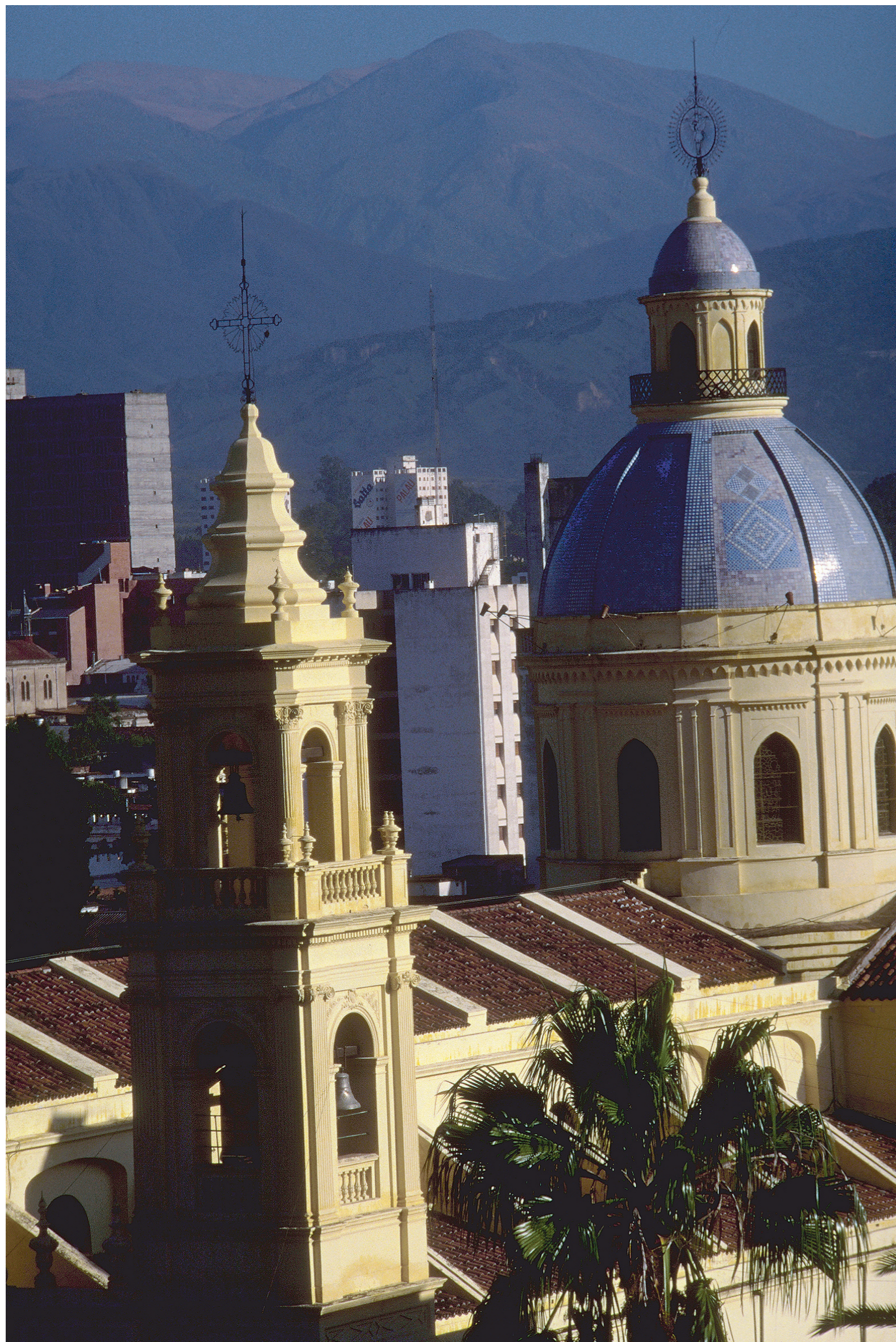
Desde Salta capital, paseos y excursiones por la selva, los valles y los embalses.