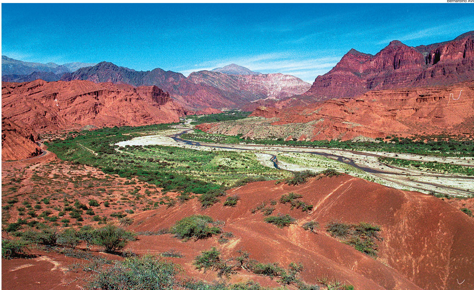
Para algunos viajeros, la belleza profunda del paisaje salteño sólo reluce bajo el sol veraniego.