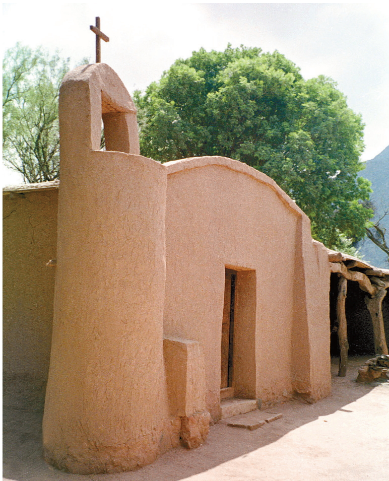
La Ruta del Adobe es un itinerario por el patrimonio arquitectónico colonial del NOA.

Excursiones: 2 días/1 noche partiendo desde la ciudad de Catamarca, e incluye las visitas a la Quebrada de la Cébila, Villa Mazán y Aimogasta en La Rioja, city tours en Tinogasta, Fiambalá, Termas de Fiambalá y la Ruta del Adobe. Precio: $250 por persona en base doble, alojamiento en las posadas con desayuno, guía turístico y vehículo con aire acondicionado. Más información: Servicios Turísticos "Tur Alternativo", Lavalle 652 6° Piso Of. "A", Capital Federal. Tel. 5556-9092 al 95. Sitio web: www.tur-alternativo.com.ar e-mail: info@tur-alternativo.com.ar