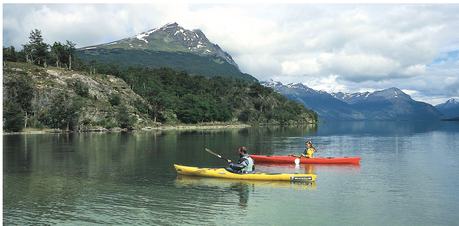
Canoas, remos y cañas para combinar pesca con paseos acuáticos.

En el sitio web de la Municipalidad de Ushuaia se encuentran las tarifas actualizadas de todos los hoteles: www.e-ushuaia.com Más información sobre hospedaje y restaurantes: Cámara de Turismo de Ushuaia: www.tierradelfuego.org.ar/ctu