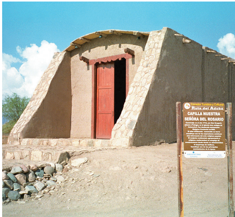
La capilla Nuestra Señora del Rosario es de 1712. Techo de caña y barro, y piso de tierra.

La llamada "Ruta del Adobe" es un singular circuito turístico de la provincia de Catamarca que recorre una serie de edificios e iglesias de varios siglos de antigüedad, construidos con madera y adobe. Queda en el departamento de Tinogasta, 280 kilómetros al oeste de la capital de la provincia.