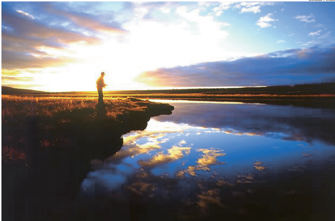
Una jornada de pesca en los ríos y lagos fueguinos bajo el cielo de la Isla Grande.