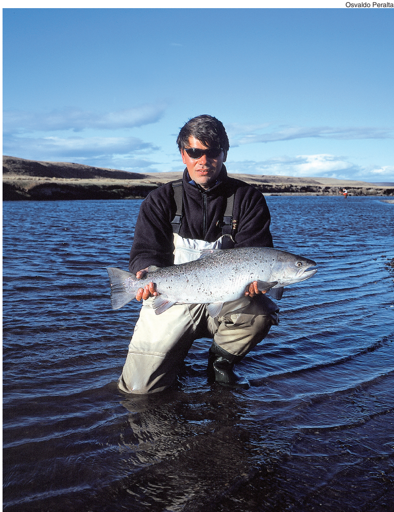
Marrones, del arroyo o Arco Iris, todas las truchas son de muy buen tamaño.