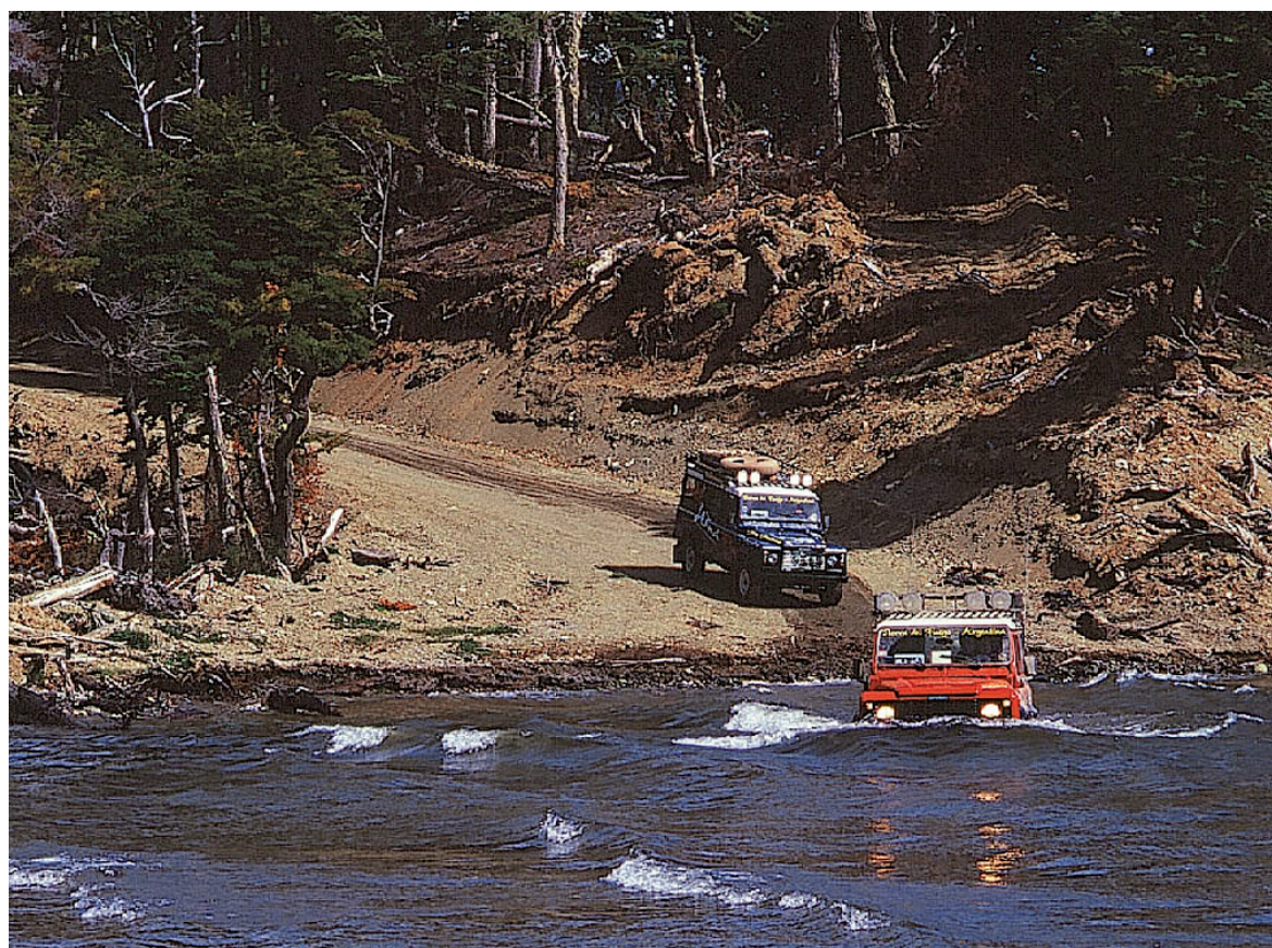
Excursiones a bordo de las poderosas camionetas Defender para atravesar todos los obstáculos.

Un buen lugar para sorprender a las truchas in fraganti son los pozones que se forman cerca de las castoreas, esa suerte de diques construidos con palos por los castores. En ese lugar las truchas se oxigenan y al mismo tiempo se sienten seguras, ya que los castores son vegetarianos. Durante un muy buen día de pesca pueden salir alrededor de 12 truchas marrones, con un porte medio de 2,5 kilos. Entre las piezas más grandes pueden haber una o dos de siete kilos. Los guías le sugieren al pescador que devuelvan las piezas al agua –la mayoría acepta–, y lo máximo que está permitido por ley es llevarse una por persona por día. Las excursiones parten a las nueve de la mañana y duran hasta las 18 horas e incluso más. Los grupos son de hasta seis personas. Para los grandes expertos de la pesca con mosca hay excursiones de alta complejidad a sectores con ríos encajonados y con mucha vegetación a los costados, donde el lanzamiento es más difícil.