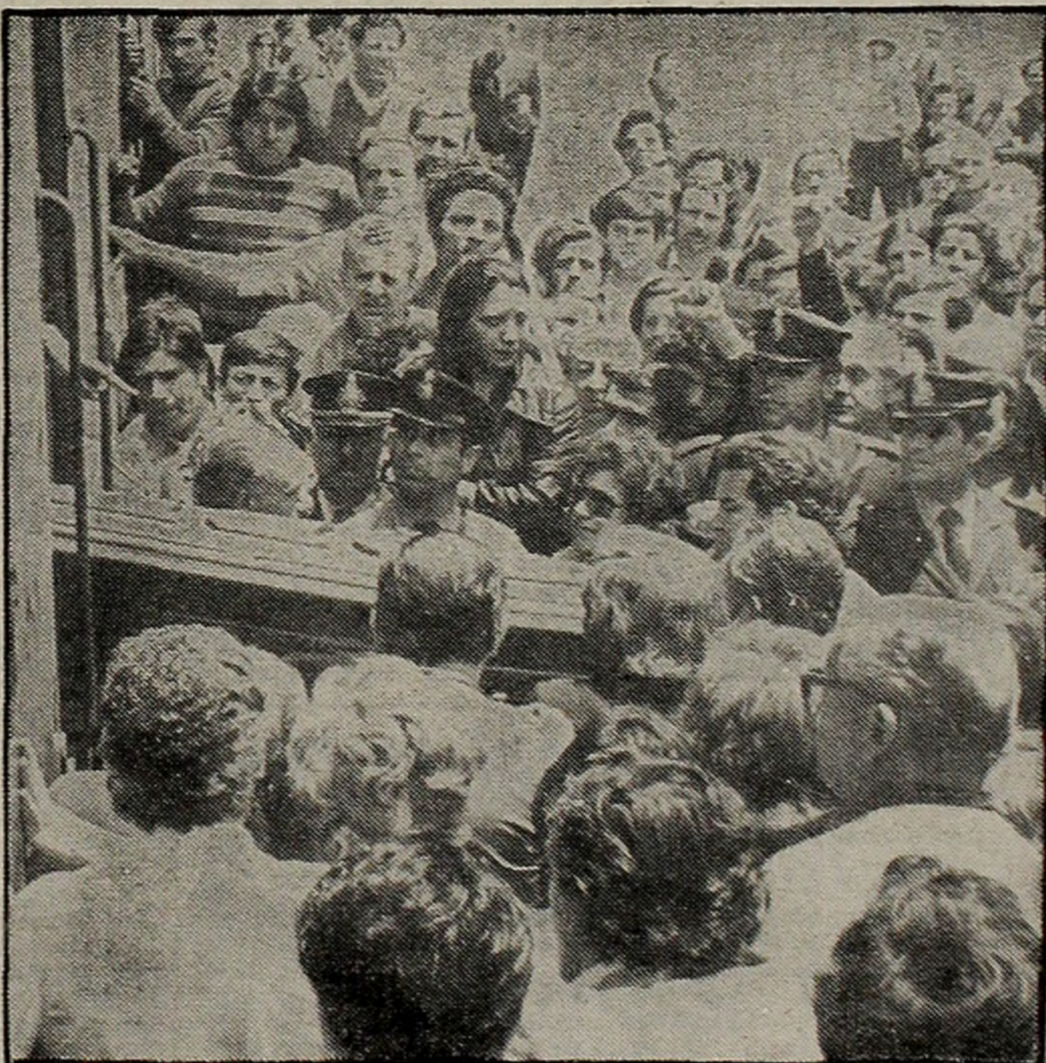
CONGOJA. Conmoveras escenas se vivieron esta mañana en Retiro al arribar los féretros con los restos de tres argentinos que fueron fusilados en Chile.