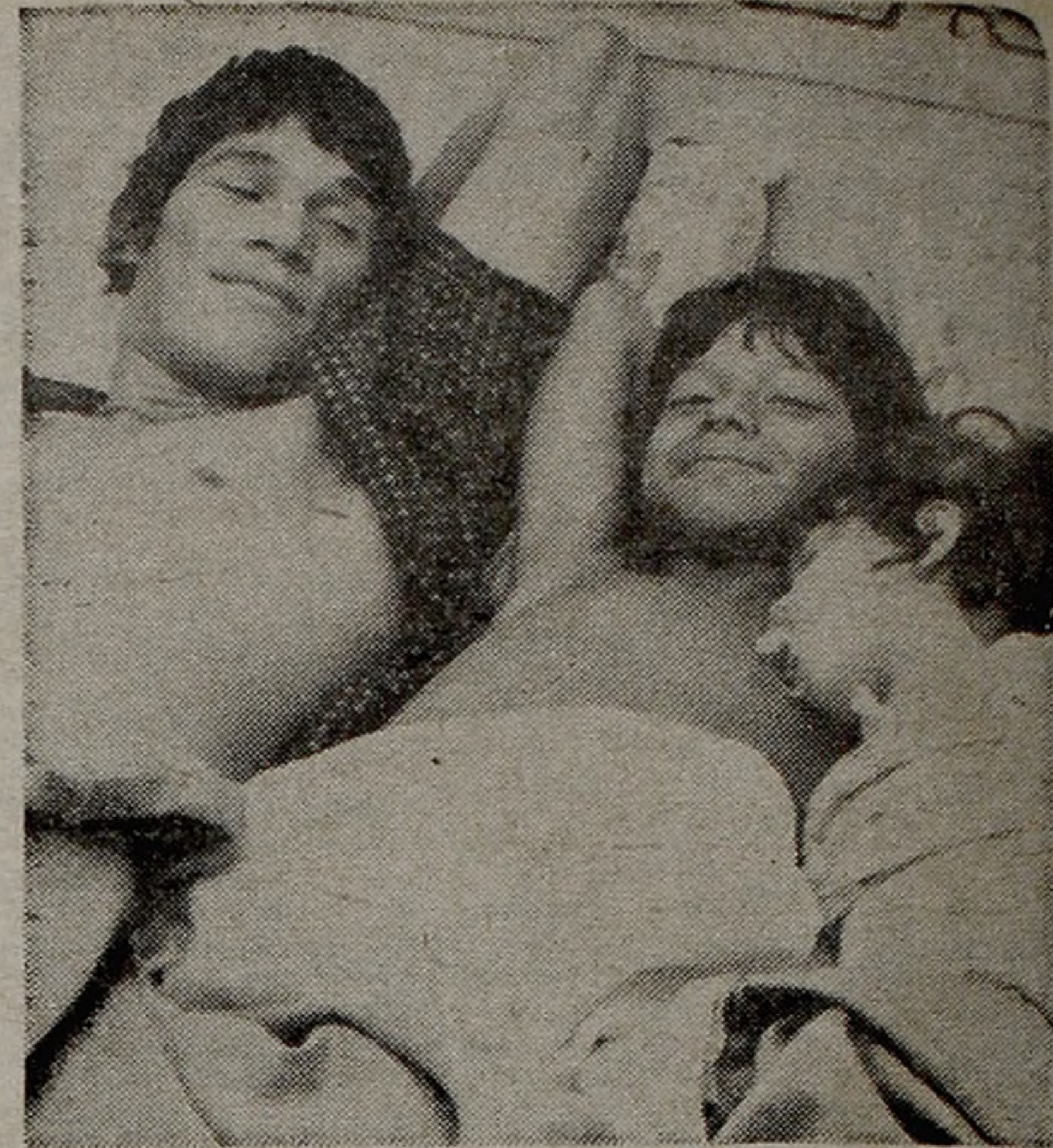
SU MEJOR TERAPEUTICA. La compañía de sus pequeños hijos, reconforta el ánimo de nuestro campeón Monzón.

Tito Lectoure, frente a la situación creada, que obligó forzosamente a diferir la pelea Monzón-Nápoles, sin poderse precisar, de momento, la nueva fecha procedente, nos dijo que pasado mañana lunes, a las 17, mantendrá otra conversación telefónica con el promotor Alain Delon, para establecer fecha definitiva.