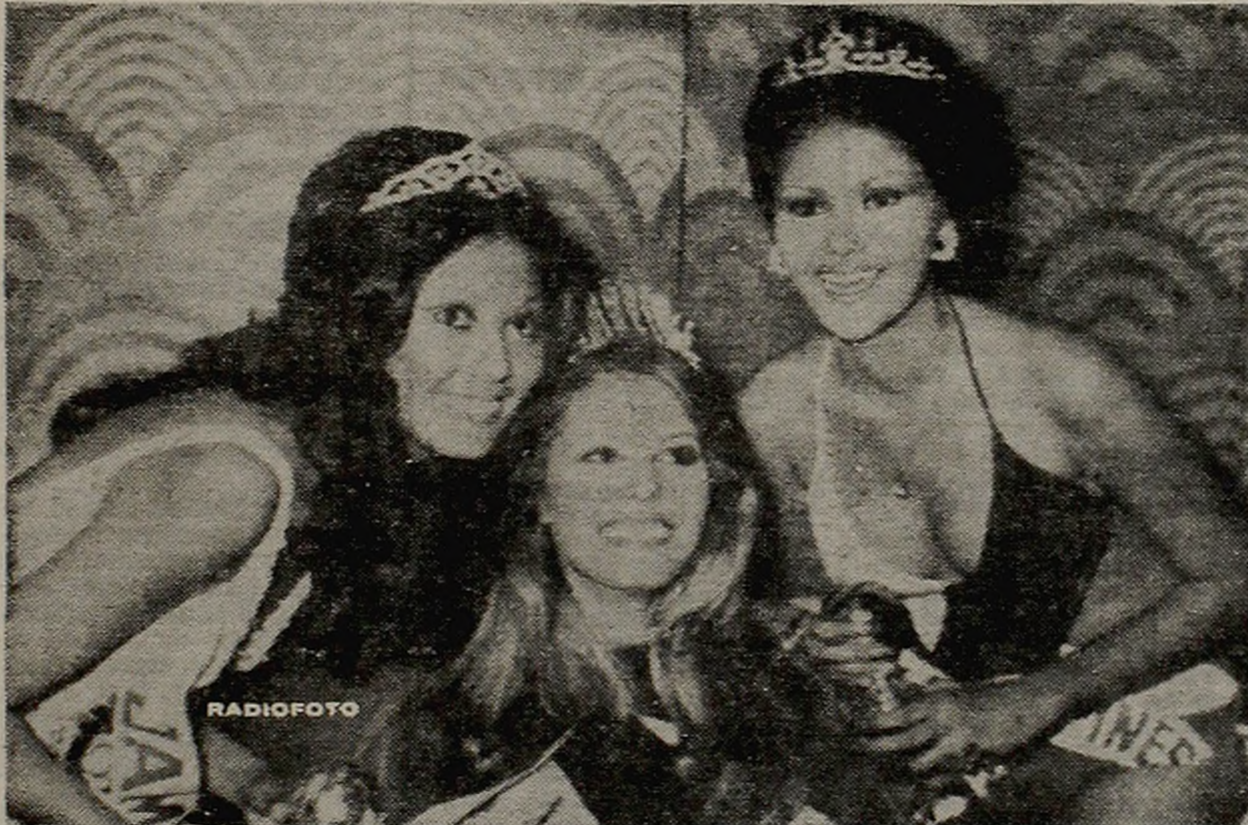
¿QUE TAL LAS PRINCESAS? Flanqueada por dos imponentes princesas, Miss Filipinas y Miss Jamaica, luce sus atributos de mando la flamante reina del mundo.

Cuando caía el telón final el domingo, más de 3.2 millones de personas habrán visto "La ratonera" de la ahora octogenaria y famosa novelista policia! Agatha Christie.