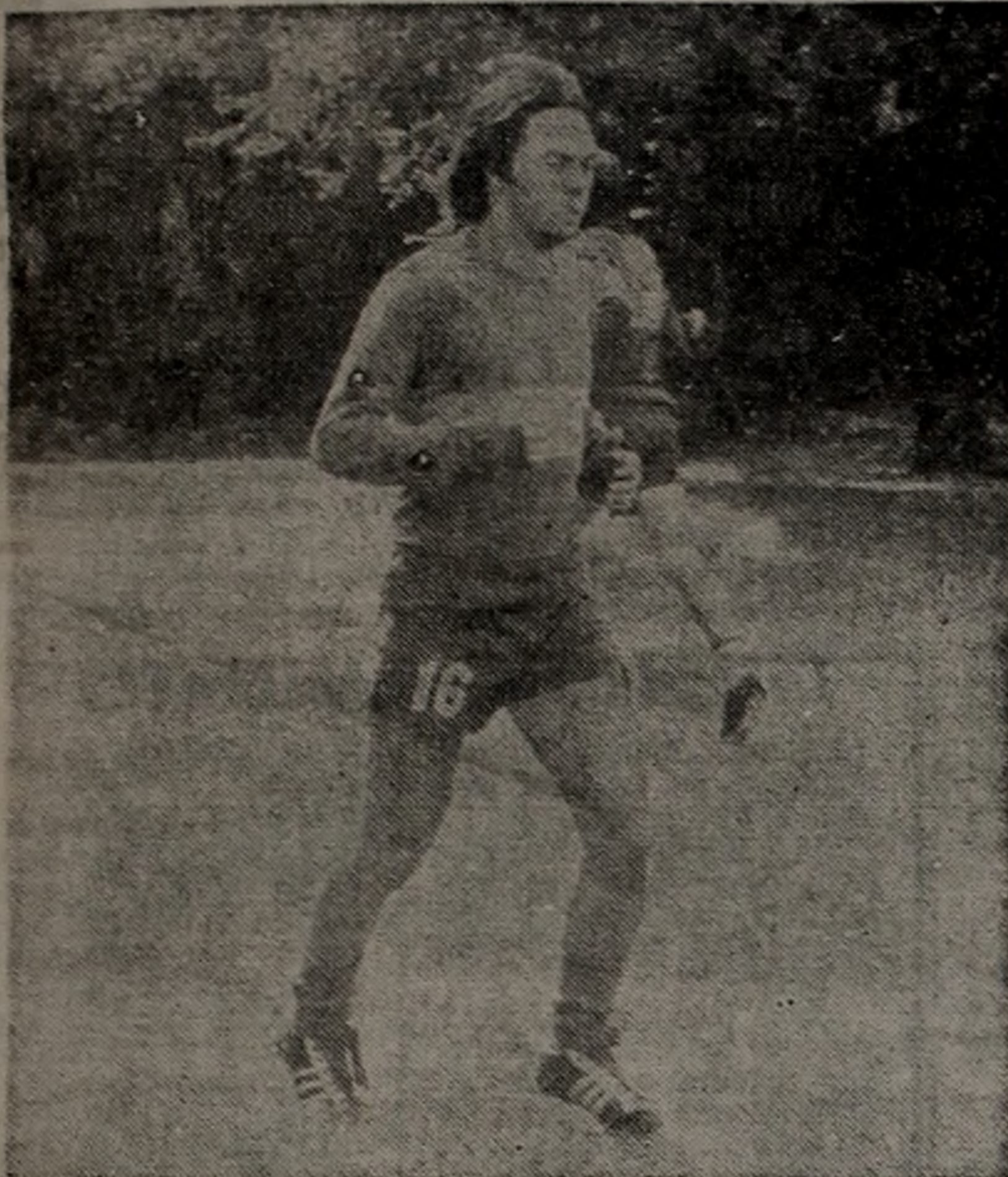
"CHINA": Viene dispuesto a conquistar la Boca. El player brasileño se halla a prueba y es muy factible su contrato.