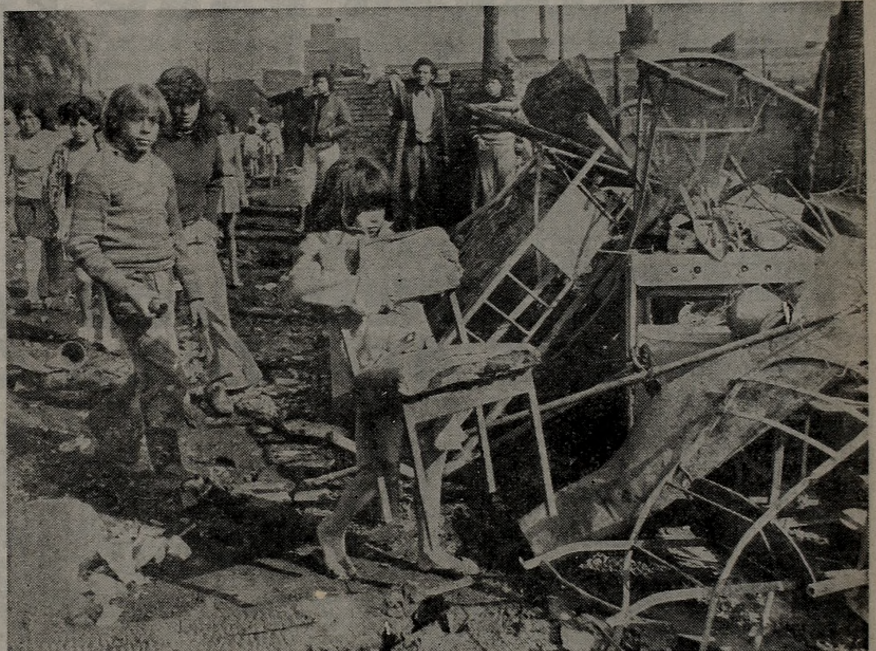
DOLOROSO. En las primeras horas de esta madrugada un incendio destruyó 17 viviendas en la villa ubicada en Bouchard y América del Norte, en Lanús. Cien personas quedaron sin techo. Entre ellas niños como éstos que contemplan la tragedia. (Pág. 11).

Paino sostuvo que Conti ostentaba, en el "organismo" de la Triple A, el cargo de "coordinador" entre grupos "de acción psico-óptica" y "de ejecución", dando a este último término su sentido lato.