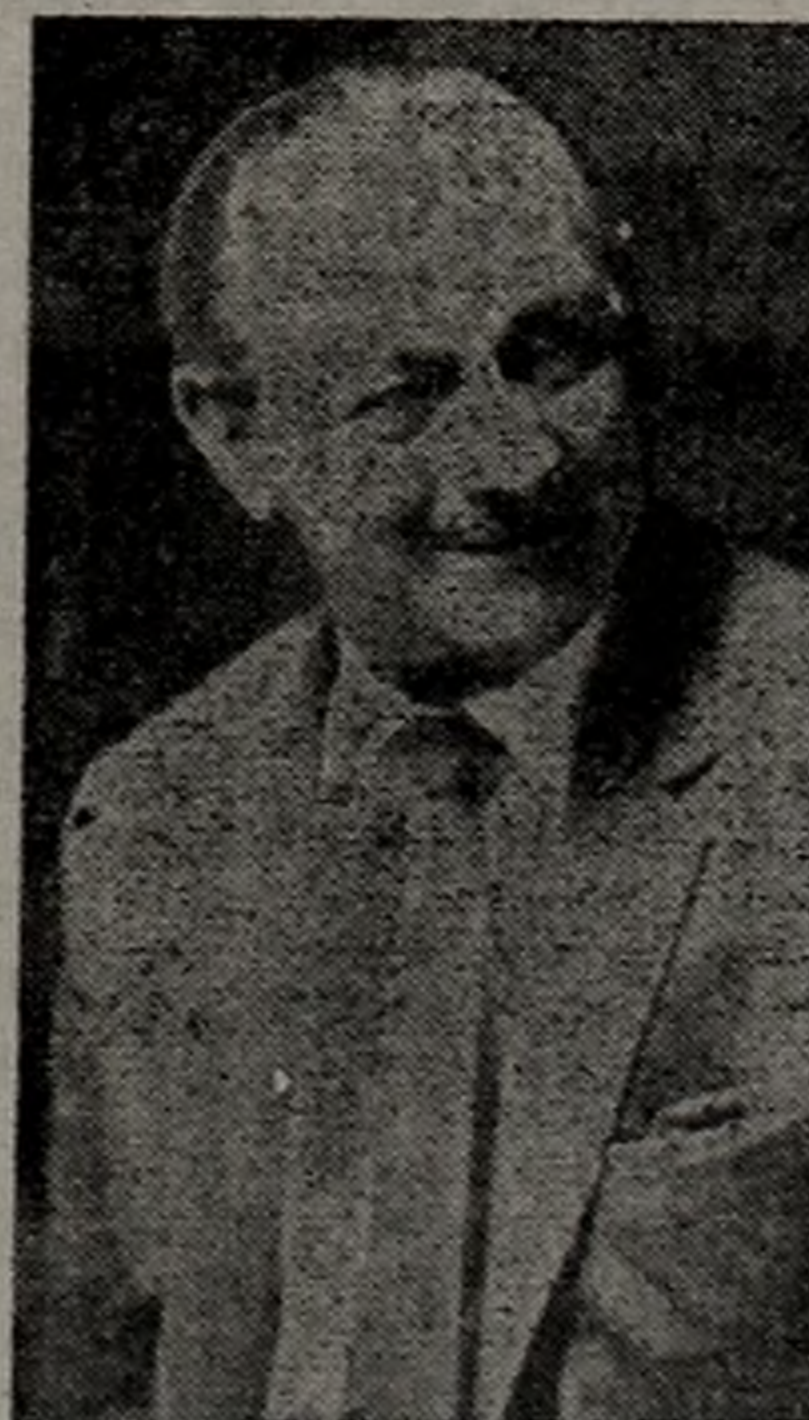
BATTAGLIERO. Fue crack y romántico del fútbol.