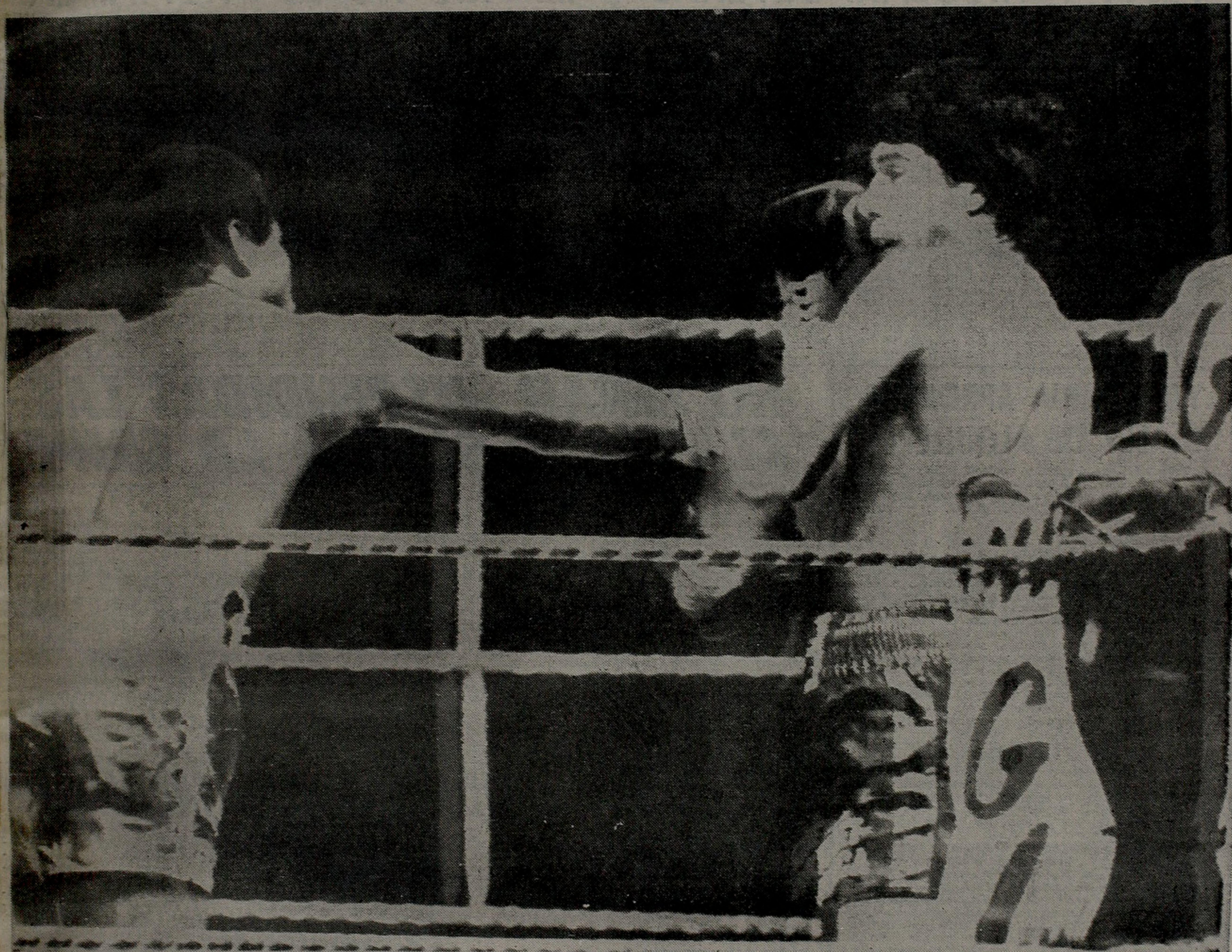
AL AIRE. El derecho de Rodrigo Valdés es bien esquivado por Monzón, quien, además, se cubre impecablemente. En los primeros instantes de la pelea, el argentino hizo prevalecer su plan de pelea, pero luego la falta de aire le permitió al colombiano emparejar. En el decimocuarto round un golpe de Monzón dio por tierra con Valdés y aseguró el triunfo del argentino.