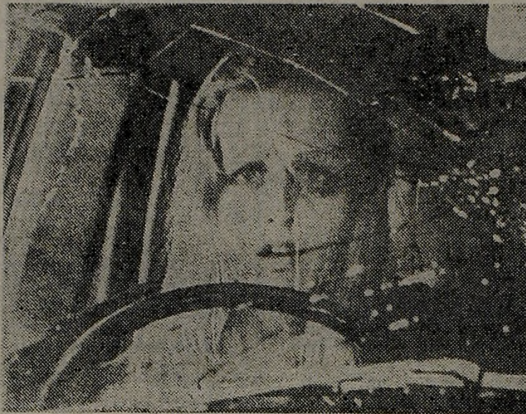
ALUCINACIONES. El horror que debe sufrir una mujer por hechos criminales es la trama de esta película.

Es indudable que "El gran soñador" se va a convertir en el éxito de la actual temporada, pues la crítica especializada ha demostrado a través de distintos artículos, que la labor de Marilina Ross es impecable, mostrando facetas, que hasta ahora le eran desconocidas y que avalan aún más su extraordinaria trayectoria artística.