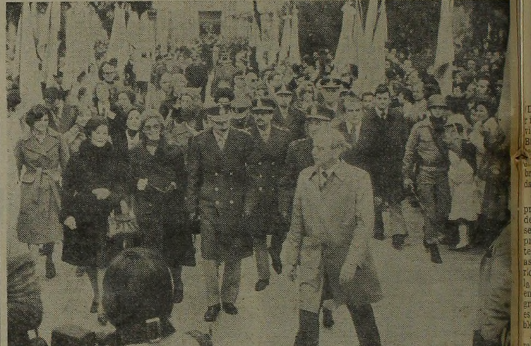
FINAL DE LA GIRA. Acompañado de las más altas autoridades de Corrientes y de su comitiva el presidente visitó lugares de la provincia en el final de su gira.

El diálogo que sostuvo el presidente con la juventud tuvo un lugar relevante en Corrientes. En la oportunidad señaló la necesidad de que el país pueda tener "descendencia", crear el partido de las Fuerzas que, en el momento actual, "cabida y que este proceso corra a redera". "No la estamos llamando a la rebeldía para el futuro", manifestó el jefe del Ejecutivo, "Manténmoslos hacia un sistema democrático fuerte y estable y agregó: "Deben ser las instituciones que sustenten por el desarrollo del país concretas que expresan esa democracia también que "estamos viviendo que hay que ganar no solo en el