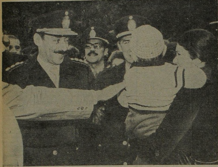
ACOGIDA. Gran cantidad de personas se acercaron al presidente de la Nación al producirse su arribo a Corrientes. El general Videla correspondió a todos.

CORRIENTES, 16 (De nuestro corresponsal). — El anuncio de que las provincias podrán acceder a los mercados externos sin necesidad de depender de Buenos Aires para sus exportaciones e importaciones, constituyó uno de los temas fundamentales abordados por el presidente de la Nación durante su estadía en esta capital, en el marco de la gira efectuada por la Mesopotamia argentina.