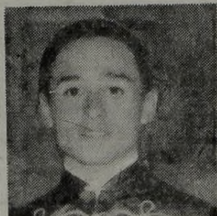
GORRAIS: Gran Negrito quedó en puerta. Le tiene le.

Por consiguiente deberemos tenerlo en cuenta para evitarnos cualquier tipo de sorpresas desagradables. Es el sport de la carrera.