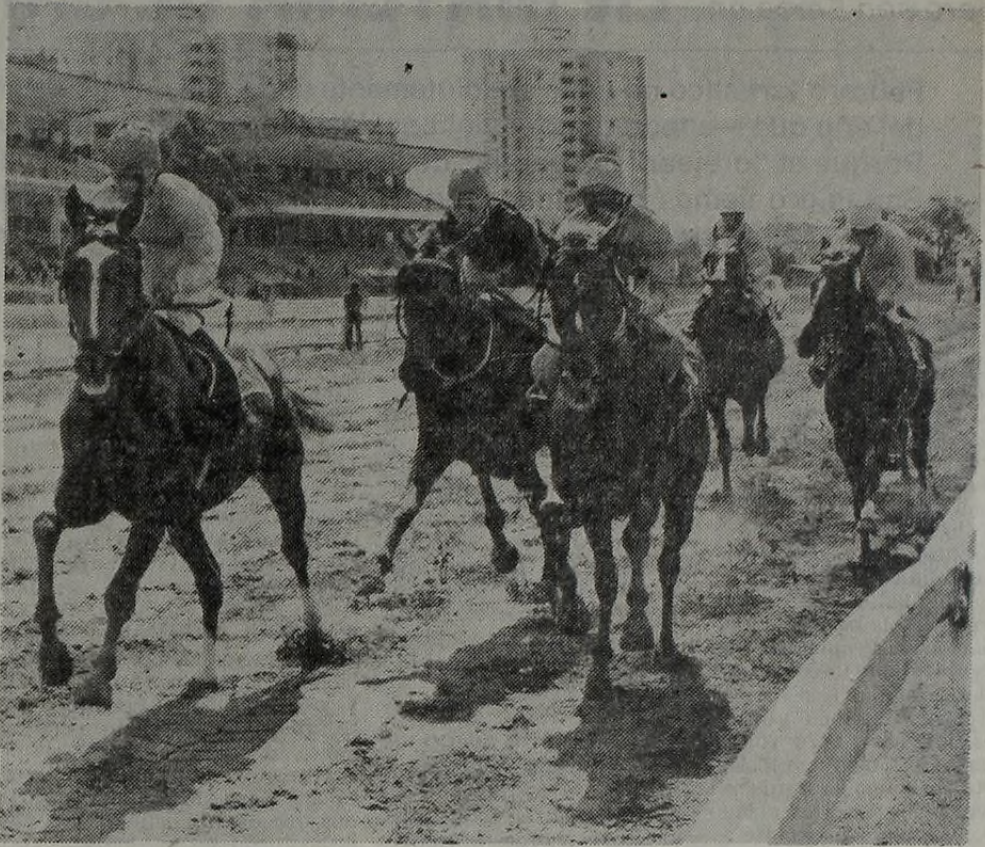
LA MEJOR SORPRESA EN LA FINAL - El cotejo de desquite está "plagado" de hijas. La carta más sólida es Greek, pero guarda con El Scheriff. Los puede meter presas.