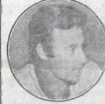
Delem - San Lorenzo