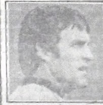
Jáuregui - Quilmes

Me lo dijo una gitana: Aunque lo tilden de lírico y soñador, el campeón será Colón. Bueno, al margen del versito, me pongo serio y les digo que creo en mis muchachos. Tengo gente capaz y estamos en condiciones de conseguir el título. No es una opinión apresurada. No sé si se nos va a dar, pero haremos lo posible.