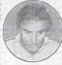
Vigo - Huracán

Es un campeonato duro. Creo que el título está entre Independiente, River y Vélez. Con respecto a nosotros, yo le puedo decir a la hinchada que All Boys este año va a respirar tranquilo. Me parece que hemos formado un equipo que no correrá riesgos con el descenso.