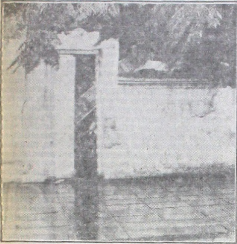
Frente de la casa en Caballito, ocurrió dudosa muerte.

Si bien todo parece producto del abandono y la miseria, la policía investiga la muerte de una anciana de alrededor de 80 años, que fue hallada en una "pseudocasa" de la calle Morelos 1575, en Caballito Norte, en medio de un escenario realmente tétrico. Un hijo de la mujer, que se hallaba junto a la madre, está detenido preventivamente hasta establecer las causas del deceso.