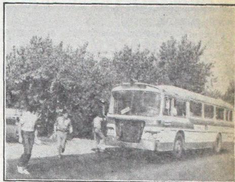
Cruzar la ruta 8 a la altura del kilómetro 35 es una peligrosa aventura. Es imprescindible un puente.

Hablar sobre los inconvenientes que esta instancia puede acarrear sería redundante. Es preferible advertir a ENTEL para que tome medidas.