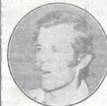
Solari - Vélez

Es un campeonato largo, son nada menos que 36 partidos. Es bravo, sí, pero yo tengo la suerte de dirigir un equipo que es especialista en ganar torneos largos. Si en algún momento perdiéramos terreno porque la Copa nos crea algún problema, después lo recuperaremos.