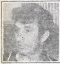
Rattin - Boca

La larga duración del campeonato hace que el equipo que tenga aspiraciones a ganarlo deba contar con un plantel numeroso. No me gusta adelantarme a los acontecimientos y por lo tanto no voy a arriesgar nombres. Voy a trabajar para que San Lorenzo sea el campeón, pero no voy a pronosticar.