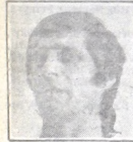
Yudica - Estudiantes