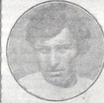
Montes - Tigre

El candidato es, por lógica, aquél que esté haciendo mejor las cosas. ¿Quién es?... Y yo no sé cómo se están moviendo todos los equipos. A mí me gusta Quilmes y arriesgo dos nombres más: Independiente, porque me gustó como jugó en la "Copa de Oro" y Estudiantes, porque Yudica sabe.