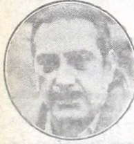
Juárez - Colón

Si yo pensara que no es Talleres el campeón, no hubiera firmado contrato con la institución cordobesa. La meta de Talleres es el título, porque hay plantel, confianza y la experiencia acumulada durante años de estar en las finales de varios campeonatos nacionales. Ojalá se nos dé, será una gran alegría.