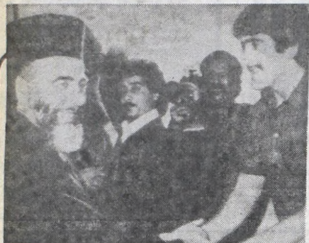
La visita de Hilarion Capucci a los rehenes "es particular y no fue enviado por el Papa" (Rad. UPI).