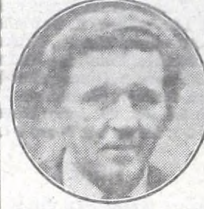
Cap - Platense

Le tengo fe a mis dirigidos. Sé que estos campeonatos largos son difíciles, agotadores y que hay que tener reservas no solo físicas, sino también de jugadores para poder sobrellevar lesiones, suspensiones... Yo confío en nuestra fuerzas y es por eso que mi pronóstico es el siguiente: Boca.