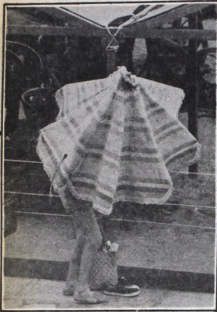
Todos los recursos son buenos para cubrirse de las torrenciales lluvias, en las playas marplatenses

El dinero provenía, al parecer, de una empresa metalúrgica que trabajaba para el Ministerio y para la Compañía de Transportes Públicos de París. En un control de los libros de la empresa, las oficinas del fisco notaron que se habían contabilizado cuatro millones de francos para prestaciones sociales, a pesar de que no existían los empleados correspondientes.