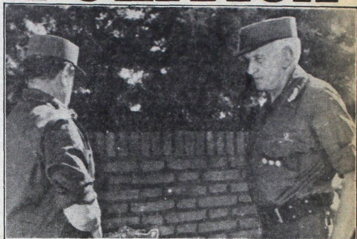
Galtieri y Bussi descubren una placa en el aniversario del Operativo Independencia.

"Unión nacional y voluntad política constituyen los factores que deben movilizar e impulsar a la Nación para permitir en esta década alcanzar el gran país deseado. En aras de ese objetivo, en esta tierra tucumana y en muchos lugares del territorio nacional, yacen nuestros héroes de esta guerra y de otras anteriores. Su memoria debe servir de ejemplo para comprender y grabar en lo más profundo de nuestra conciencia que la guerra no es el camino que exigimos para nosotros ni deseamos para nuestros hijos. Nuestra lucha hoy es por el progreso en paz de la Nación. Por esas ideas, esos objetivos, rogando la protección de Dios, convocamos a todos los argentinos. Y reclamo de sus hijos aquí presentes, efectivos de la V Brigada de Infantería y en voz alta a todo el Ejército argentino: subordinación y valor". A lo que los soldados respondieron: "Para defender a la Patria".