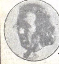
Grigol - Ferro

Creo que nadie puede negar que el año pasado, en el Nacional, estuvimos a punto de conseguir el título y, ojo, no solo por estar en la final, sino por como fueron esos partidos con River. Además, no perdimos ninguno de los dos. Por eso, porque me tengo fe y porque sé lo que pueden rendir los muchachos: Unión.