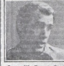
Saporiti - Rosario Ctral.

Sería un "loco" si nombrara algún equipo en especial. Pienso que en la cancha no existen rivales fáciles, son todos difíciles. Creo que Huracán va a realizar una gran campaña, aunque no aseguraría que saldremos campeones, otros candidatos pueden ser River, Independiente, Vélez y Racing.