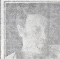
Volken - Unión

No voy a hacer un balance de posibilidades de todos los equipos para dar mi pronóstico. Ustedes me hacen dos preguntas y bueno, se las voy a responder con pocas palabras... ¿Quién sale campeón?... Uno de los equipos grandes. ¿Quién descende?... Tres de los equipos chicos.