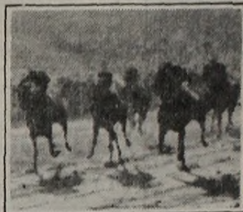
Moundrago es lógica pura en la prueba base de hoy en el palermitano.