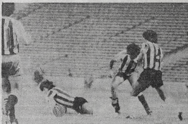
Así se jugó el partido. Todos atrás de la pelota y jugadas confusas.

CORDOBA, 11 (De nuestro corresponsal).—Tranquilo, sin hacer un gran esfuerzo pero siendo ordenado, Talleres se convirtió en el primer clasificado para los octavos de final del campeonato Nacional al empatar con Estudiantes de La Plata uno a uno. Como en el primer partido disputado en la ciudad de las diagonales los dirigidos por Maschio se habían impuesto por uno a cero, automáticamente pasaron a la siguiente instancia.