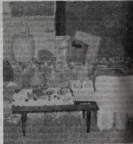
Bidones con cientos de kilos de droga listos para comercialización, fueron secuestrados por la policía.

Es evidente que la situación irregular del mercado de locaciones, desproporcionadamente favorable a los propietarios, obliga a los que pretenden alquilar un inmueble para vivir, a someterse a las maniobras de improvisados agentes inmobiliarios que, en realidad, son meros delincuentes que lucran con la necesidad del pueblo.