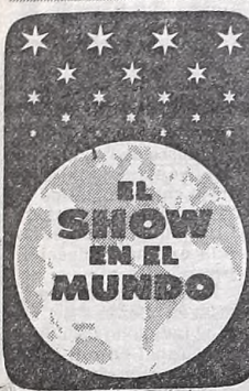
MEMPHIS, (Estados Unidos).— El cantante Jerry Lee

Lewis se encontraba hospitalizado en condición estable tras ser sometido a un tratamiento de emergencia por lo que fue descripto como una posible reacción alérgica a "demasiados" relajantes musculares.