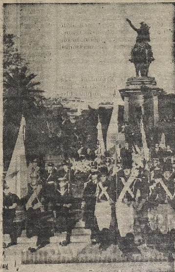
Momento en que los abanderados de las agrupaciones presentes en el homenaje a San Martín inician la retirada hacia sus respectivas unidades.

A las 15, hora en que nuestro prócer dejó de existir, una trompa del Regimiento de Granaderos tocó a silencio, mientras el público guardaba un momento de recogimiento. Posteriormente, aviones de la Fuerza Aérea Argentina desfilaron sobre el lugar y una batería efectuó una salva de 21 cañonazos. Terminada esta parte del acto, el Presidente de la Nación y su comitiva se instalaron en el palco oficial, desde donde presenciaron un desfile militar.