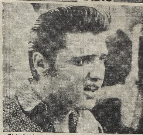
Elvis Presley: Abrir la boca vale millones de dólares.