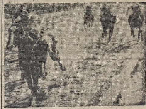
➤ Pas-si-sotte bajo la hábil dirección de Oscar Nardi, se impuso en la cuarta carrera de ayer en Palermo, donde terminó la triple. La defensora del Icaache, totalmente recuperada, puede brindar mas satisfacciones a la escudería.