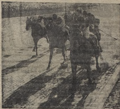
➤ Aller que fue muy favorecido durante el desarrollo del Premio General San Martín, disputado ayer en Palermo, se impuso con facilidad sobre Astorga, que atropelló reciamente al final. El tren impreso a la marcha dejó mucho que desear a quienes saben ver carreras.

ARROW, O. Tévez a la par de ITALIANITA, D. Demilio, 800 en 51"3/5; MOCHE, O. Tévez a la par de PIRATERIE, A. Gaitán, 800 en 51"2/5; PASEATA, A. Bartalotti, 800 en 52"; CATALUN, M. García, 800 en 53"; TENDELE, LOVE, E. R. Alén, 600 en 37"; MADRE ADORADA, C. Gamarra, 700 en 43".