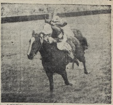
LONGHI disputará con muchas posibilidades de triunfo el premio Charolais que sirve de puente para la apuesta triple del domingo en Palermo. El hijo de Peutetre siguió al pelo y habrá que seguirlo...