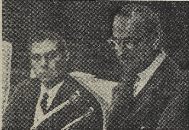
El presidente Johnson durante su discurso con motivo de cumplir cinco años la Alianza para el Progreso en el que, prometió amplio apoyo a la integración latinoamericana.

TAIPEH, 18 (ANSA). — Los expertos de la China Nacionalista (Formosa) en asuntos comunistas ponen en duda que la persona que hoy figuró en la manifestación de Pekín como Mao Tse-tung, "sea realmente Mao".