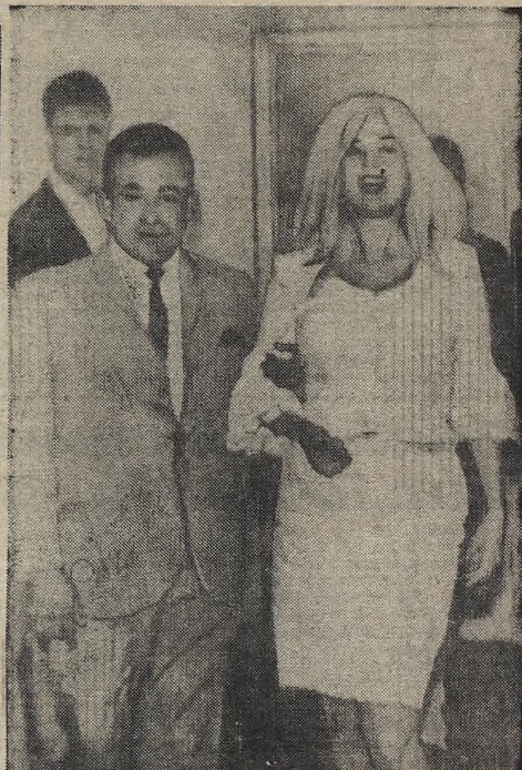
La opulenta Jane Mansfield sale de la corte de Justicia de Caracas con su abogado. Fue multada por irregularidades impositivas.