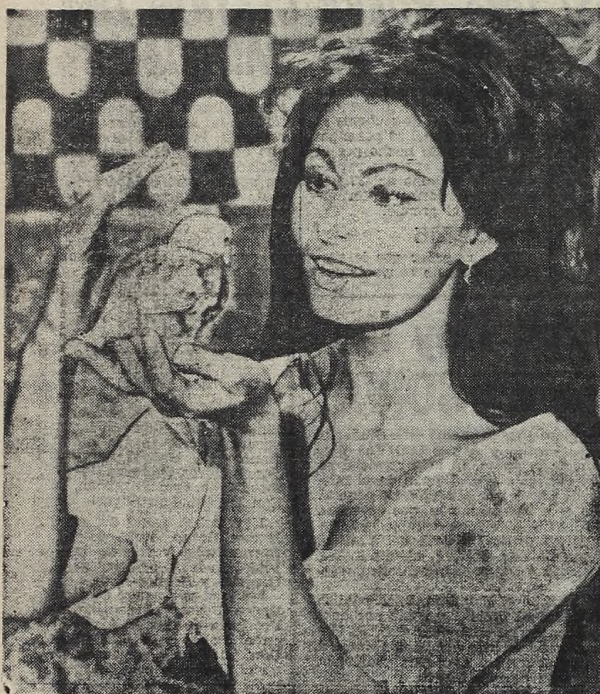
◆ Sofia Loren renunciará una vez más a la exhibición de su belleza en el cine. Aceptó un papel trascendental para su carrera (si es que todavía puede tenerlos), al dar el sí para protagonizar "Madre coraje", de B. Brecht. Simultáneamente, su rival A. Magnani lo encarna en teatro