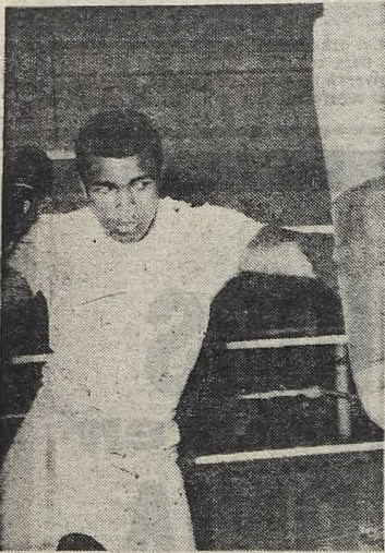
El rey en peligro. Claro que esto no lo dice él, sino su rival. El alemán Mildenberger vaticina su triunfo sobre Cassius... ¡Hum!... Veremos qué pasa.

SAN PELLEGRINO, Italia, 18 (Associated Press). — El director técnico del club de futbol Internacional, de Milán, Heleno Herrera, dijo ayer que su club estaría dispuesto a adquirir a Pelé en cualquier momento. "Pelé no está acabado como han escrito muchos cronistas después de la Copa del Mundo", ha dicho Herrera, continuando siendo el más grande jugador del mundo. Inter lo contrataría, si fuera posible, en cualquier momento".