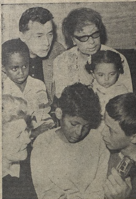
Josefina Baker junto a su esposo Jo Bouillon, y rodeada de algunos de sus hijos, pocos minutos después de haber arribado a Ezeiza. No formuló otras declaraciones. "Los niños tienen frío, y ellos están primero que todo..."

Lo hecho por la señora Baker la enaltece ante los ojos de la humanidad y nosotros, los argentinos, sentimos una inmensa satisfacción de tenerla entre nosotros, aunque sea por tan breve espacio de tiempo. Lapsos pequeños sí, pero lo suficientemente evidente como para comprobar una muestra cabal de un acendrado amor al prójimo. La señora Baker permanecerá algunas horas más en la Argentina y, aunque no se ha confirmado oficialmente la hora de su partida, cabe señalar que ya ha reservado 17 pasajes en una compañía de aviación para emprender un nuevo viaje. Otro viaje, otro país, que seguramente se apresta a admirar en silencio a la personificación femenina del amor al prójimo y a la solidaridad.