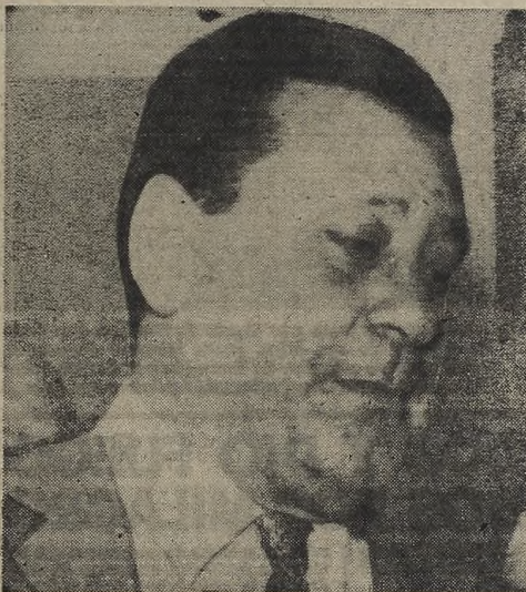
Este es Lázaro Barbieri, ex gobernador de Tucumán, cuya captura fue dispuesta por las autoridades de esa provincia. Se cree que su detención habrá de producirse en las próximas horas.

SAN MIGUEL DE TUCUMAN, 18 (De nuestro corresponsal). — Se hará efectiva una medida de la policía de la provincia por la cual se erradicará a los mendigos con problemas de salud, a los ebrios que pululan por el centro y algunas barrios, y a quienes disturban su vagancia con la mendicidad. La policía dictó orden de detención contra cada uno de ellos.