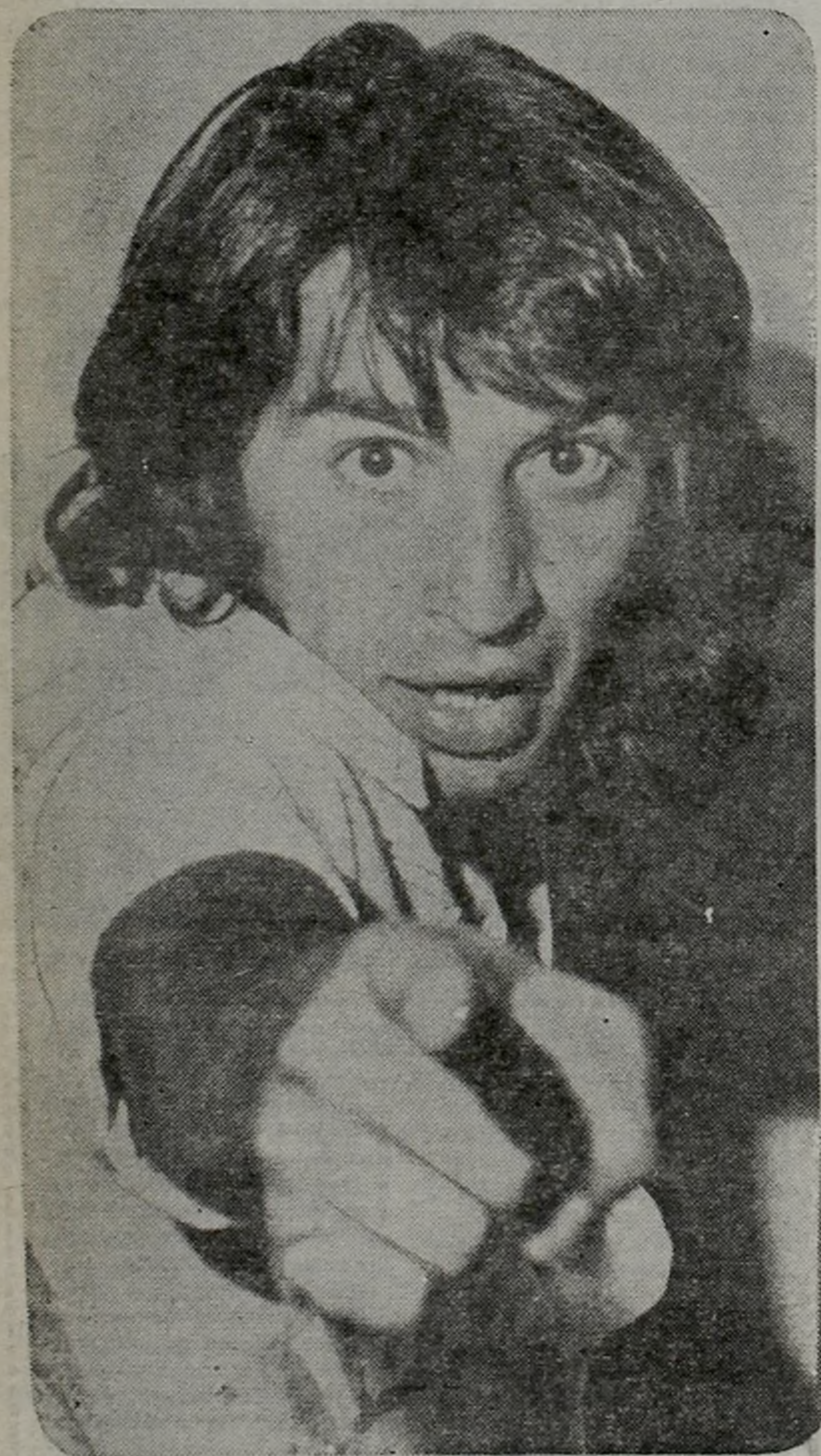
OTRA CAMISETA. Sandro y un sensacional pase de sello.

La noticia no es de esas que pueden darse muy a menudo. Suele suceder, pero muy de cuando en cuando, que un cantante y compositor de primera línea deje de colaborar con la grabadora que lo vio crecer para pasarse a otra de idéntica categoría.