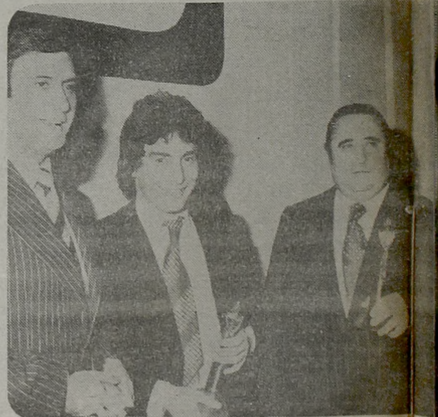
DIPLOMACIA DEL MAESTRO MUÑOZ

Fueron los cuatro momentos más emocionantes de la noche de los "Martín Fierro". En uno se premiaba al humor; en el otro, a la actriz para la que el tiempo no pasa (ni como mujer); en el siguiente, al actor que viene arrollando, luego al maestro desaparecido.