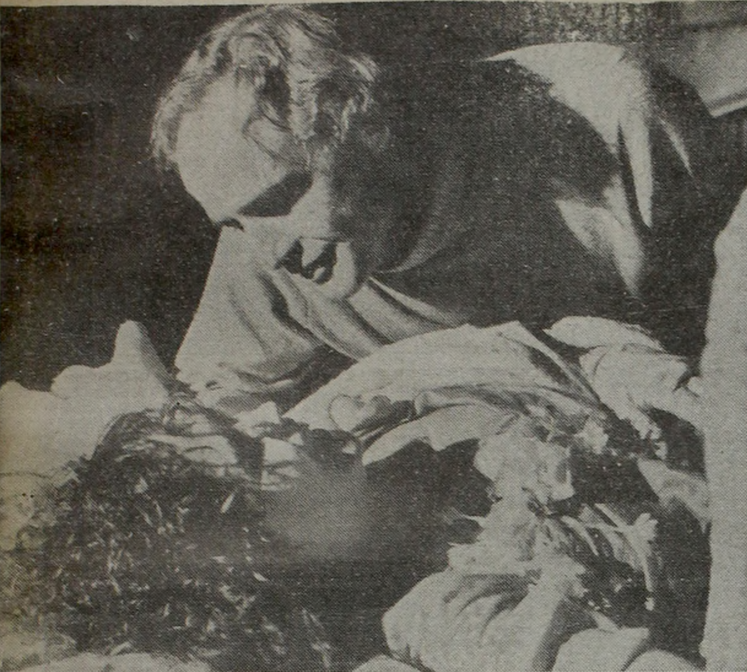
MULTIMILLONARIO. Filmó "Ultimo tango..." y ganó una fortuna. Pero no lo alivia.

últimos éxitos le han proporcionado, hasta el presente, un ingreso superior a los dos millones de dólares.