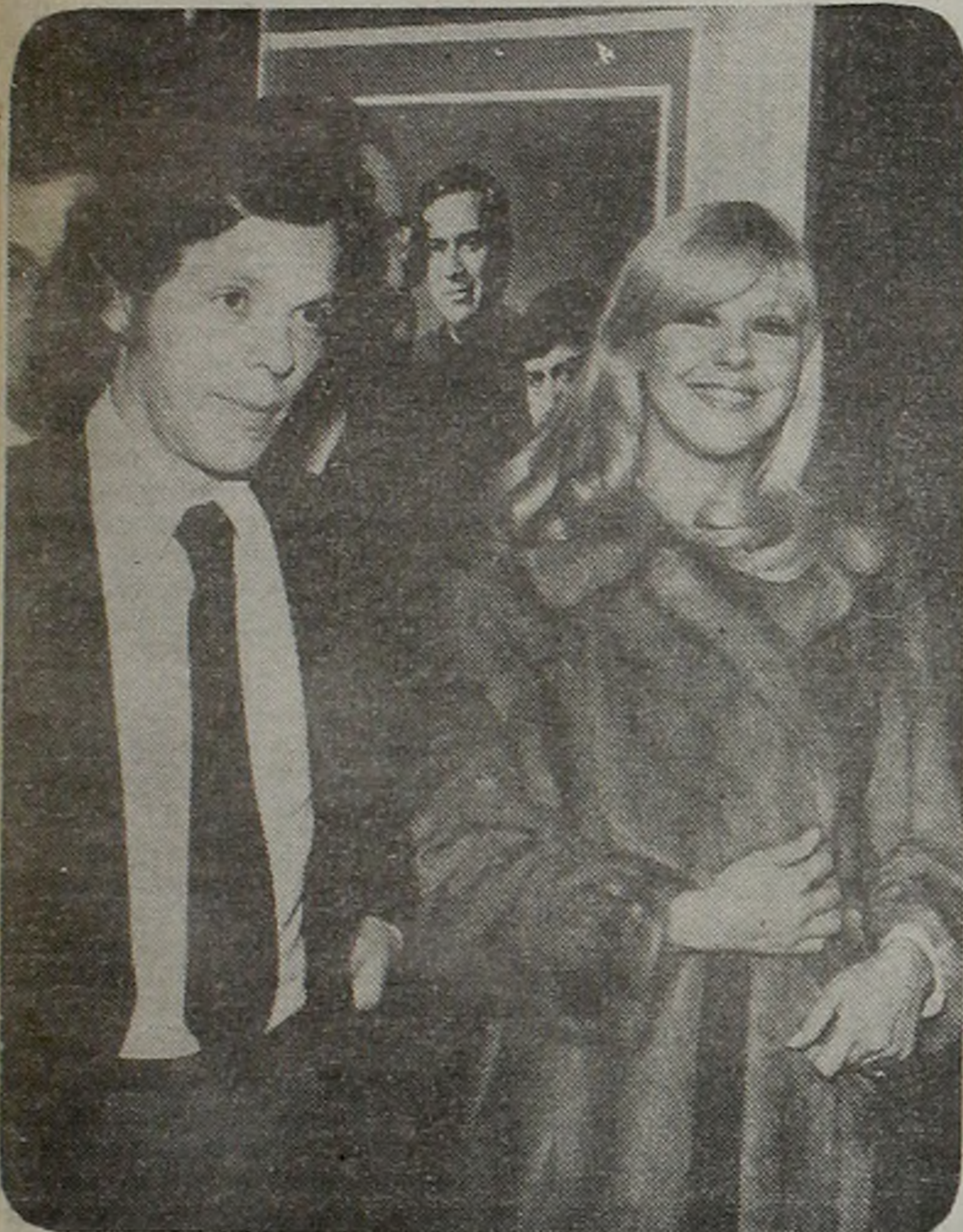
¿RECONCILIADOS? ¿O nunca separados? E. Disi-Dorys.