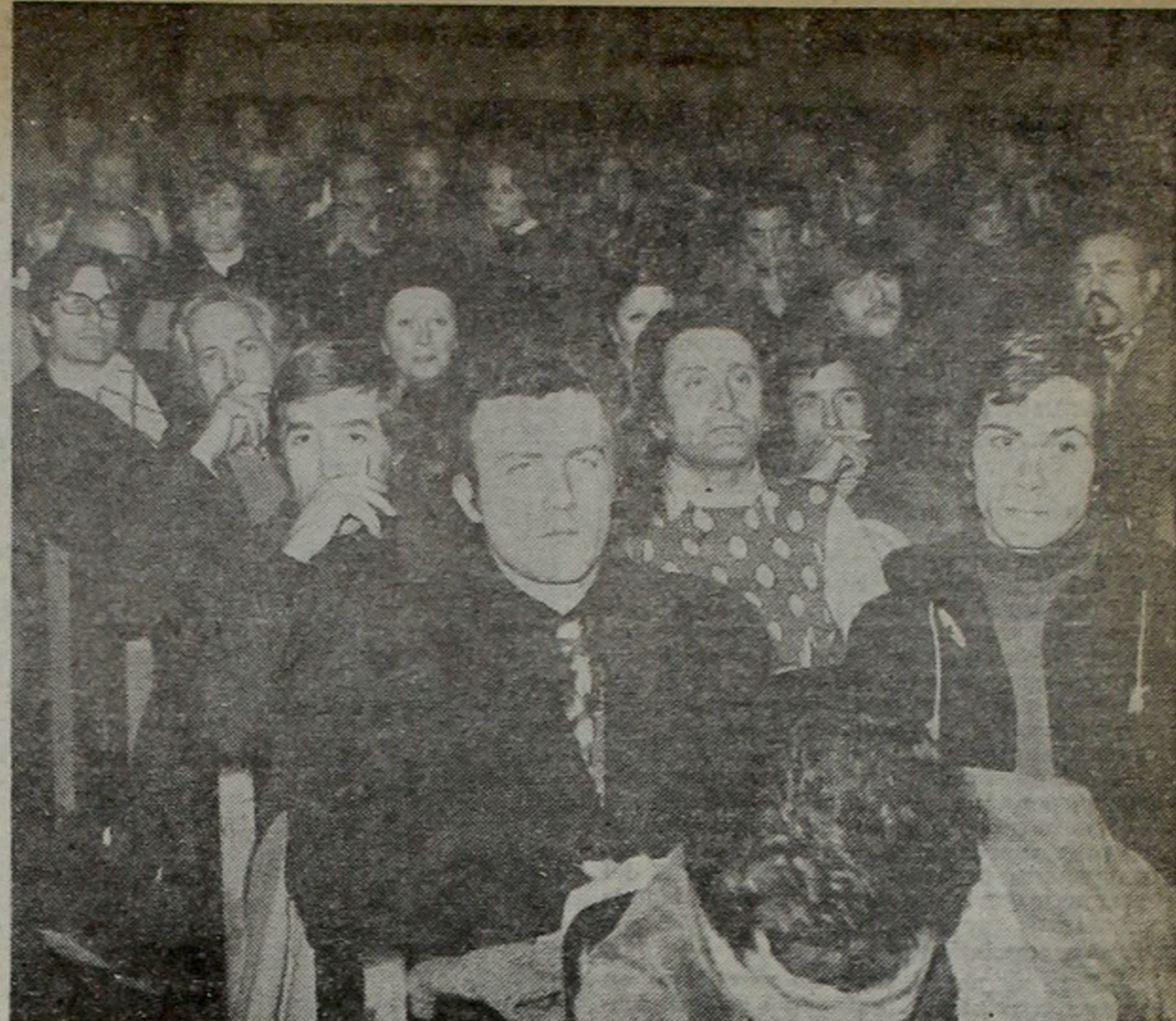
SIETE HORAS. Los actores amanecieron discutiendo largamente las medidas a tomar.