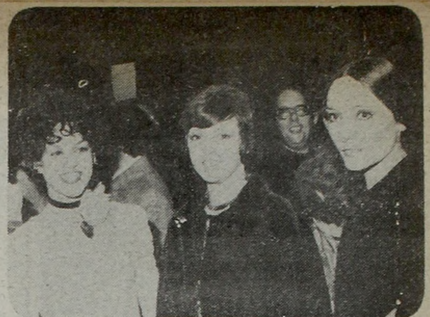
PEINADOS. Rulos de la Albertini, el chato de Ross-Bare.