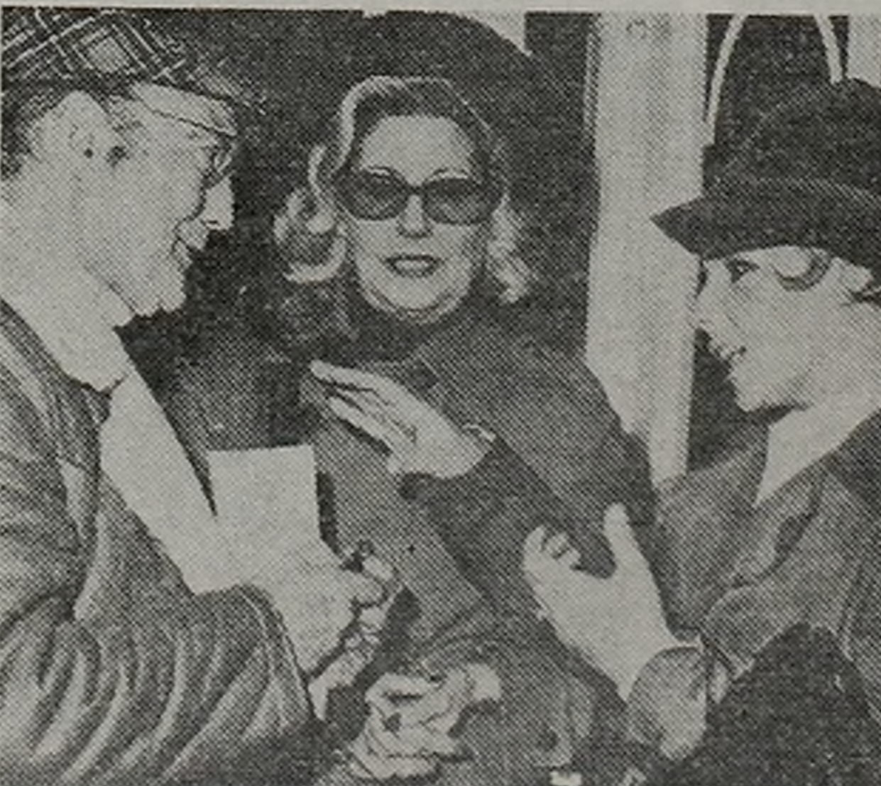
PASTO PAITOS. Primero en asambleas.