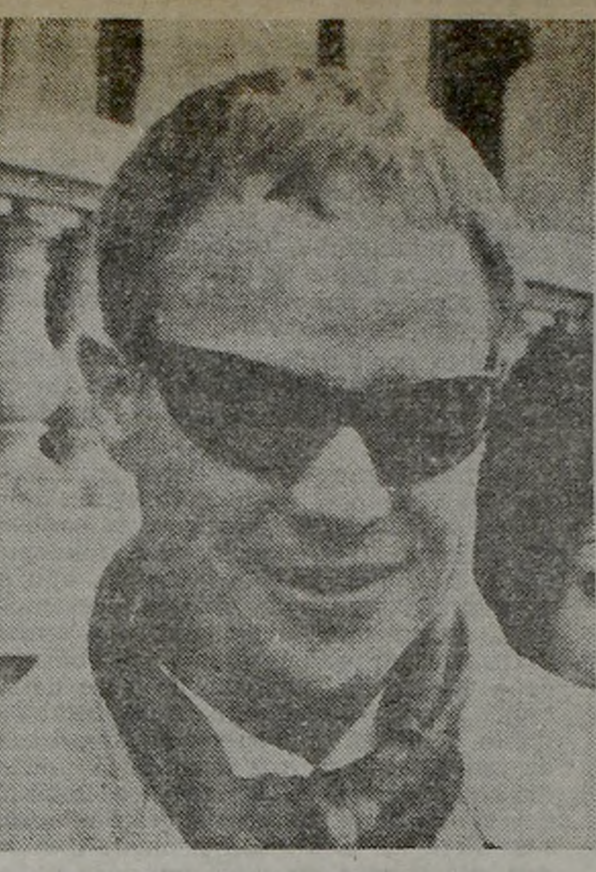
PELIGRO. Esconde drama tras gafas negras.